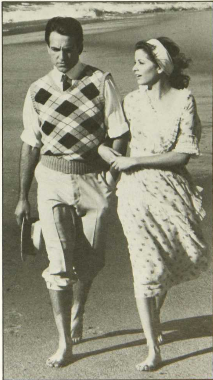
Mark Harmon et Brianne Leary