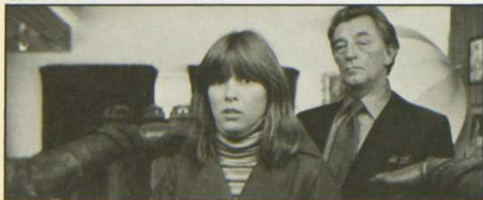
«Le Grand Sommeil»