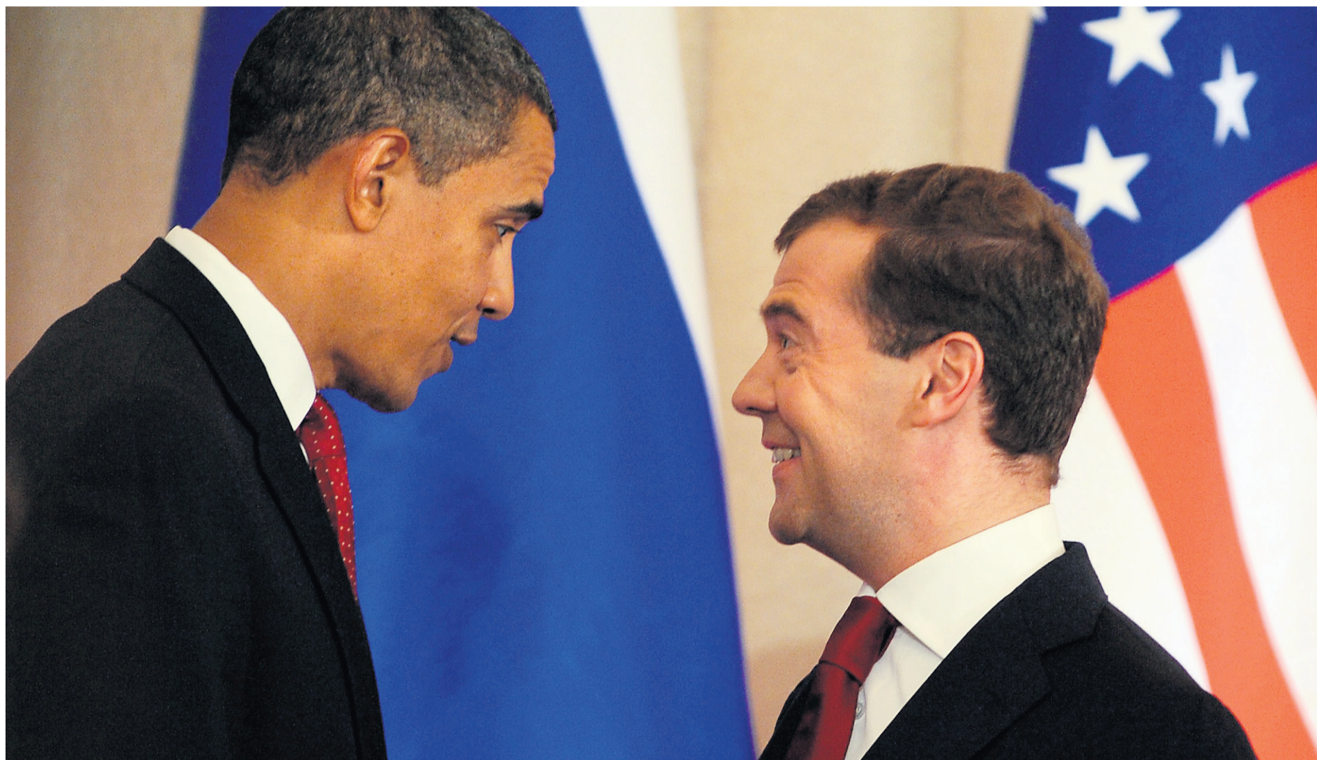
Le président des États-Unis, Barack Obama, et celui de la Russie, Dmitri Medvedev, lors d'une séance de signature officielle hier à Moscou.

Valorisez votre patrimoine. IWC. 141 ans d'histoire.