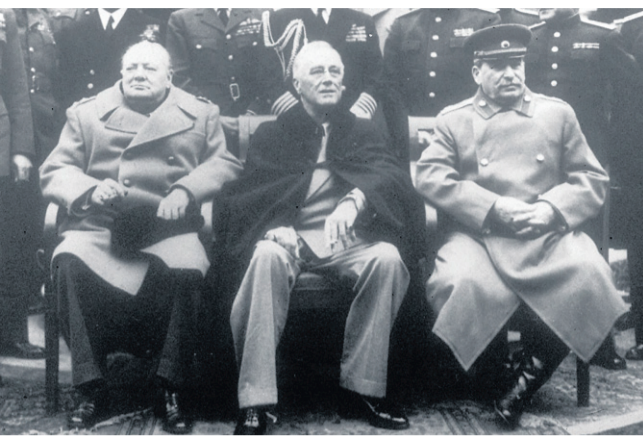
Winston Churchill, Franklin D. Roosevelt et Joseph Staline

Au gré de l'évolution des relations diplomatiques entre leurs deux pays, les dirigeants des États-Unis et de la Russie se sont rencontrés à de nombreuses reprises. Voici quelques dates qui ont marqué l'histoire.