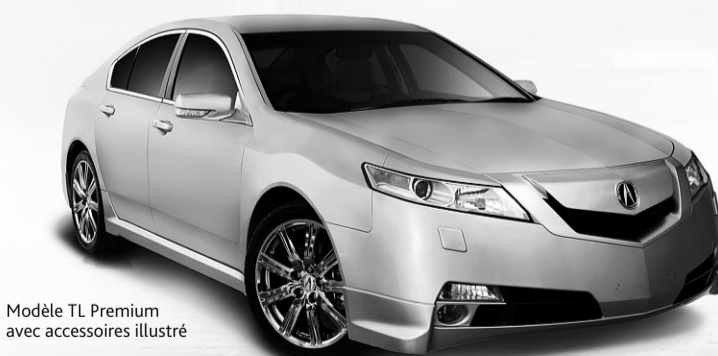
Modèle TL Premium avec accessoires illustré

Financement à 1,9 %. Adrénaline à 100 %.