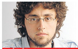
FRÉDÉRIC LAVOIE COLLABORATION SPÉCIALE

MOSCOU — Le pouvoir russe a décidé de laisser sa chance à Obama. Malgré plusieurs points de divergence encore en suspens entre Washington et Moscou, le président Dmitri Medvedev a choisi la coopération, faisant oublier l'atmosphère aux relents de guerre froide des dernières années de l'administration Bush.