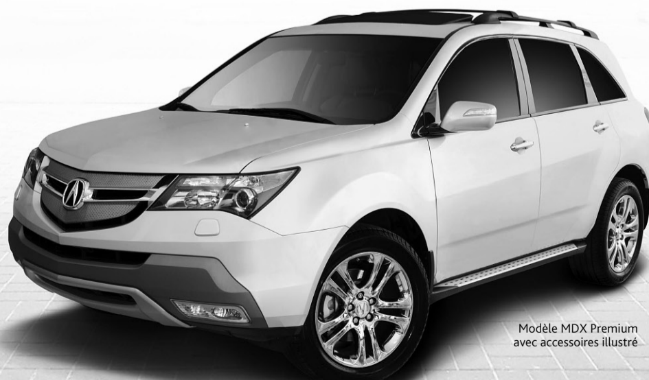
Modèle MDX Premium avec accessoires illustré

Pour connaître les dates de la tournée, visitez acura.ca .