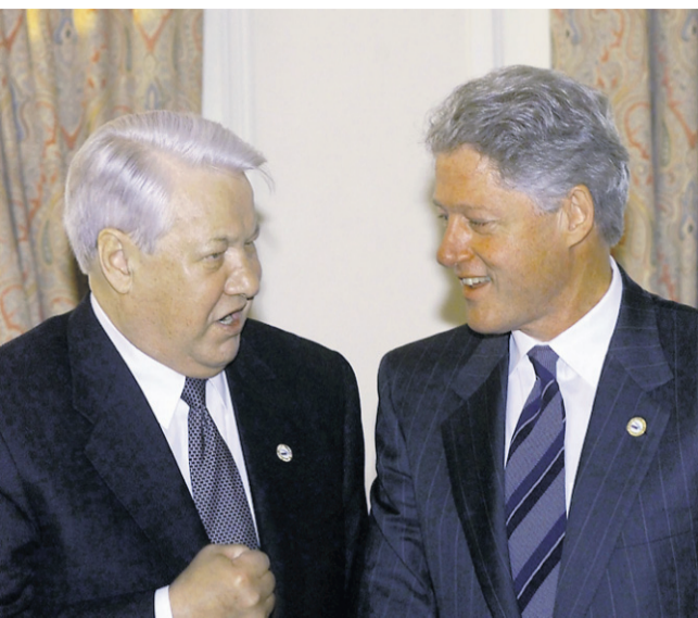
Boris Eltsine et Bill Clinton

Le président américain George Bush et Mikhaïl Gorbatchev signent le traité de non-prolifération START à Moscou.