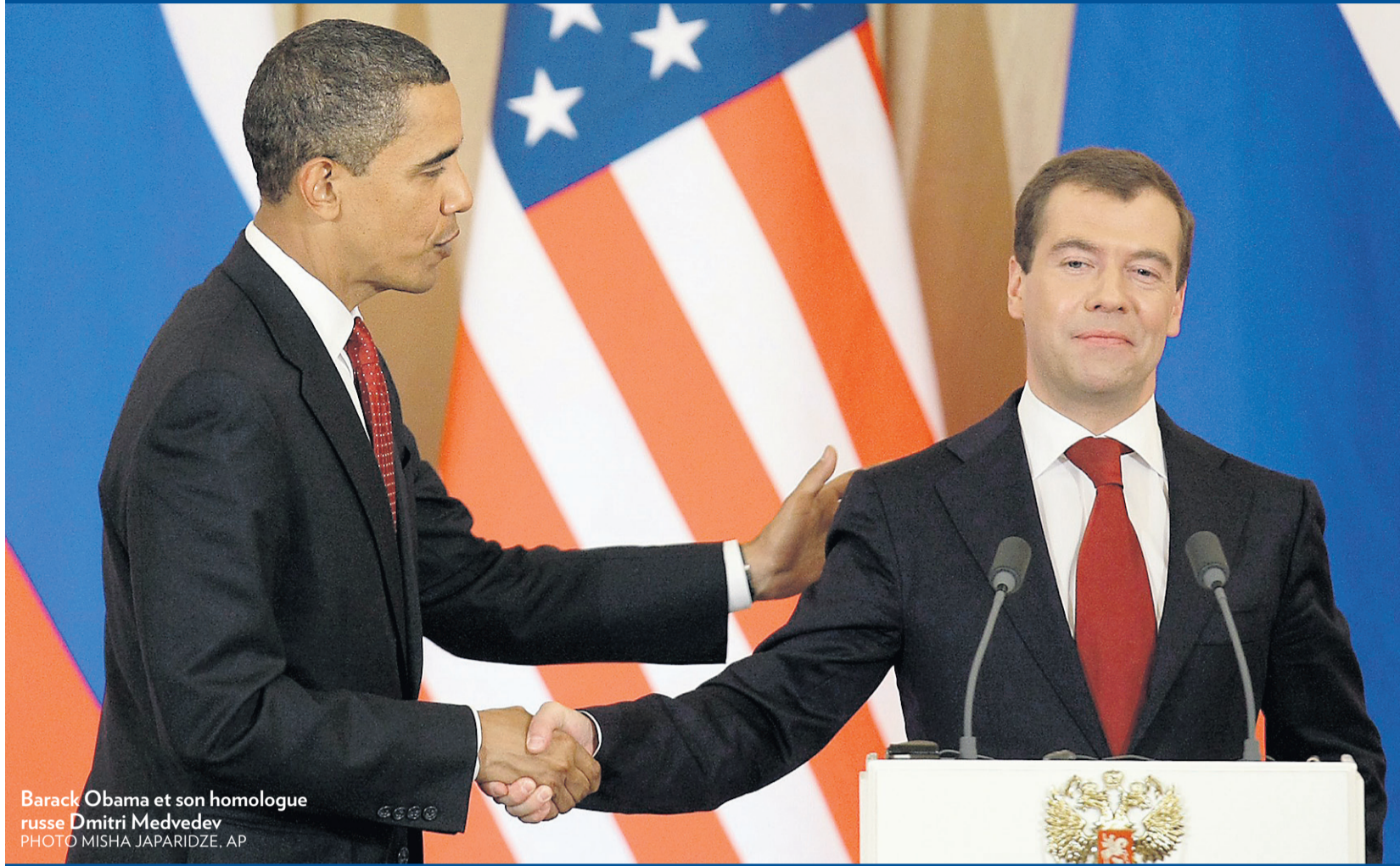
Barack Obama et son homologue russe Dmitri Medvedev