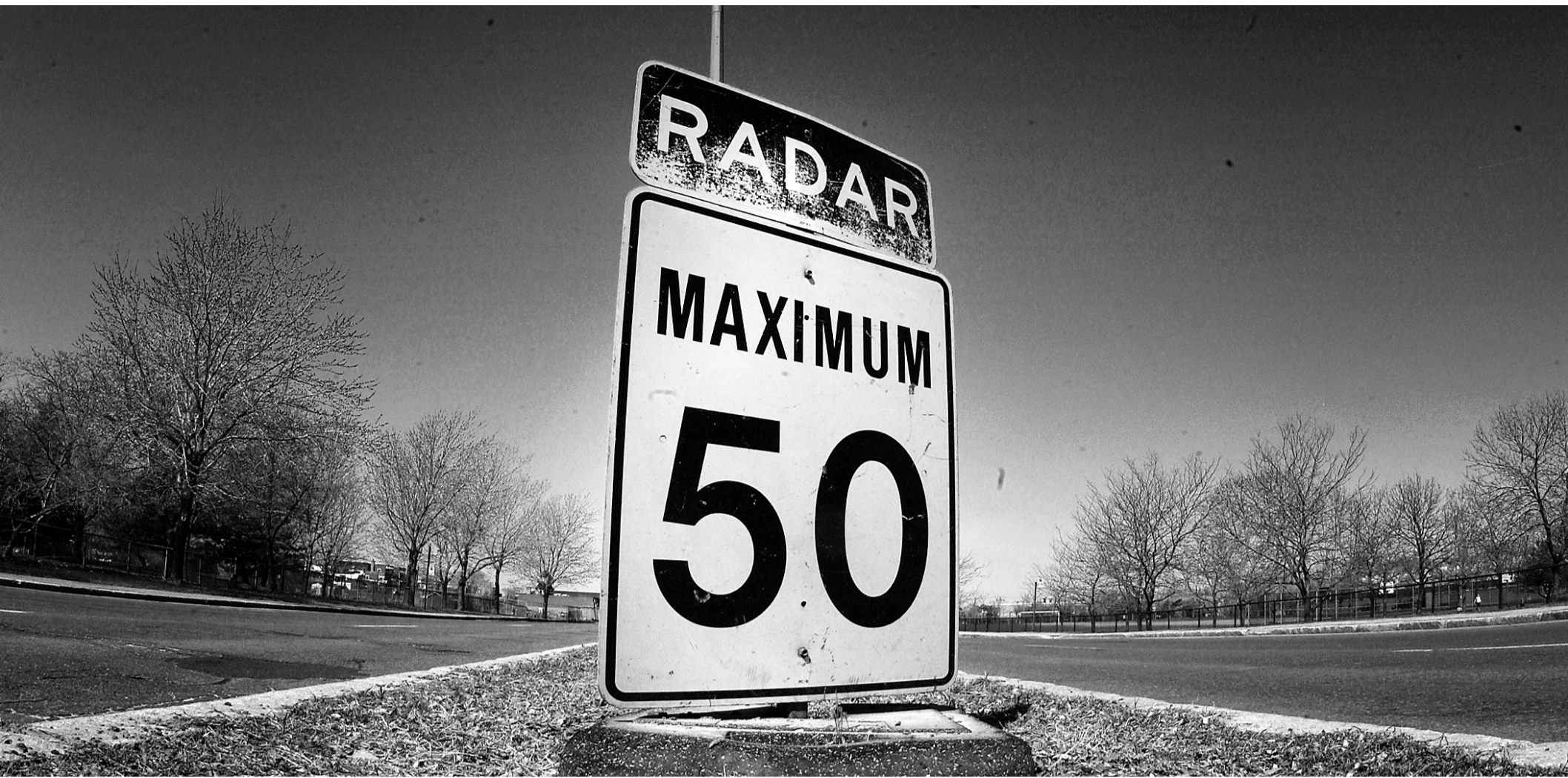
Les premiers panneaux signalant la limite de 40 km/h dans les rues résidentielles de l'île de Montréal apparaîtront d'ici la fin de l'été. La limite restera de 50 km/h dans les grandes artères, et de 30 km/h aux abords des écoles.