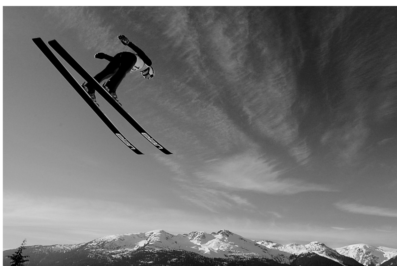
Le Comité organisateur des Jeux de Vancouver demande à l'Agence des services frontaliers du Canada et à la GRC de l'aider à débusquer les athlètes étrangers tentés d'utiliser les substances interdites par l'Agence mondiale antidopage.

« Les responsables de la Sécurité publique, de la GRC, de l'Agence des services frontaliers du Canada (ASFC), de Sport Canada et du Comité