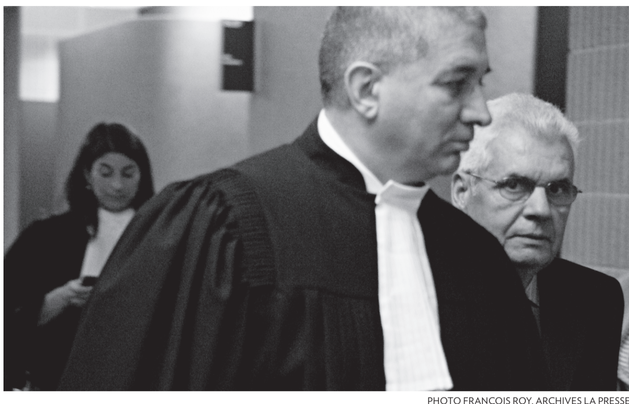
Alfonso Gagliano (à l'extrême droite), qui a perdu son poste d'ambassadeur au Danemark dans la foulée du scandale des commandites en 2004, réclamait un peu plus de 8 millions de dollars pour congédiement abusif et atteinte à sa réputation.

Dans son jugement de 41 pages, le magistrat signale que M. Gagliano a été nommé ambassadeur en vertu d'une décision discrétionnaire du gouvernement. Cette nomination était révoquable en tout temps, «quelle que soit la qualité des services» qu'il rendait, a noté le juge. Comme M. Gagliano avait été le ministre responsable de l'application du programme de commandites – de 1997 à 2002 –, des soupçons de responsabilité à son égard pouvaient surgir dans l'esprit du public. Il était donc pour ainsi dire normal que le premier ministre Paul Martin s'interroge