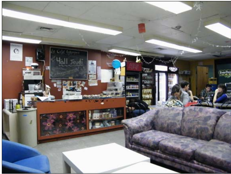
Le Café Anthro.

Café Info-Math, local 1221, pavillon André-Aisenstadt