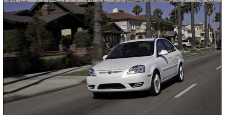
De haut en bas : La nouvelle et l'ancienne Stratos. Une Coda Sedan trop chère...