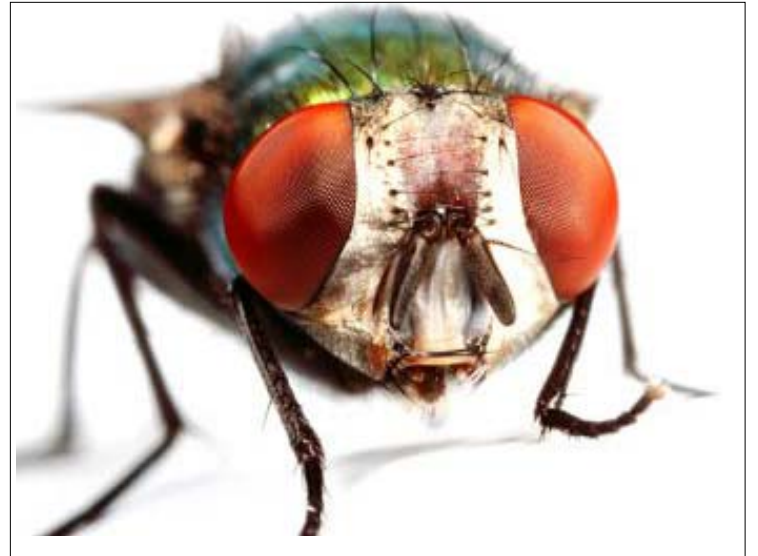
Qui voudrait vraiment faire mal à une mouche...

diversité des sources, la diversité des angles de traitement des sujets, la diversité des sujets. J'ajouterais également la pertinence des contenus. On a beau avoir une diversité de sources : LCN , RDI , La Presse , Le Devoir , le Journal de Montréal , le Téléjournal , le TVA nouvelles , Dumont 360 , le 98,5 FM, msn.ca , le Twitter de Denis Coderre ... si on parle pendant 10 minutes toutes les 12 minutes que Pat Burn n'est pas réellement mort, nous ne sommes pas des citoyens plus informés et ça relève de l'exploit de se faire une opinion juste. En ce qui me concerne ce n'est pas la quantité qui m'importe, mais définitivement la qualité de l'information.