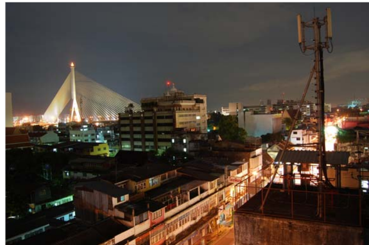
Bangkok de nuit

Il y a tellement à parler sur Bangkok et la Thaïlande mais je vous invite à m'écrire si vous voulez des bons plans ou d'autres aventures car après 3 semaines de périple, dans la jungle, à la plage, mon séjour en Thaïlande s'achève. J'espère que je vous ai donné envie d'y aller, c'est vraiment un pays fabuleux.