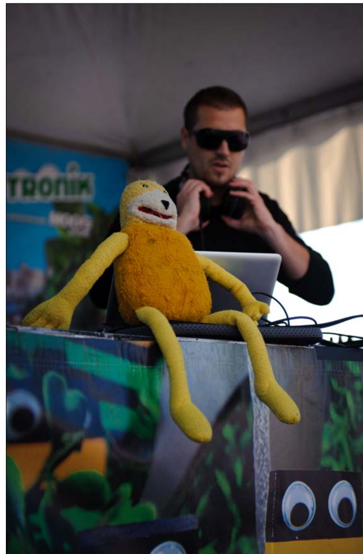
Maudite Machine et Flat Eric assis sur la console.

Devant tant de poésie, ça serait presque triste de ne pas pouvoir concrétiser ce projet.