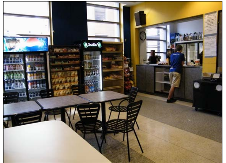
Le Café Info-Math.

L'emplacement du Café Info-Math doit faire de nombreux envieux parmi les membres des autres cafés étudiants : il est situé à l'entrée même du pavillon André-Aisenstadt. De surcroît, le local est spacieux, le décor sobre s'harmonise avec le reste du pavillon, puis la grande fenestration et la propreté exemplaire renforce l'aspect professionnel. Cependant, il manque une certaine touche étudiante. Bon, il y a une affiche très « Not Safe for Work » sur le mur à l'entrée du café et un système de son qui diffuse de la musique, mais c'est tout. À mon