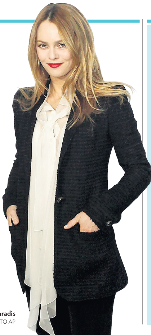
Vanessa Paradis