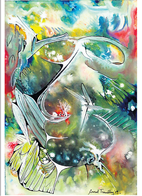
L'homme de la jungle (2009)