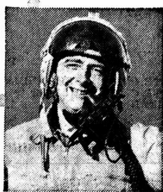
Donald Campbell — titulaire de records universels de vitesse sur l'eau

"Ayant expérimenté la supériorité des gazolines et des huiles BP pour mes épreuves de vitesse, je ne manque jamais de donner à ma voiture familiale le même traitement privilégié!"