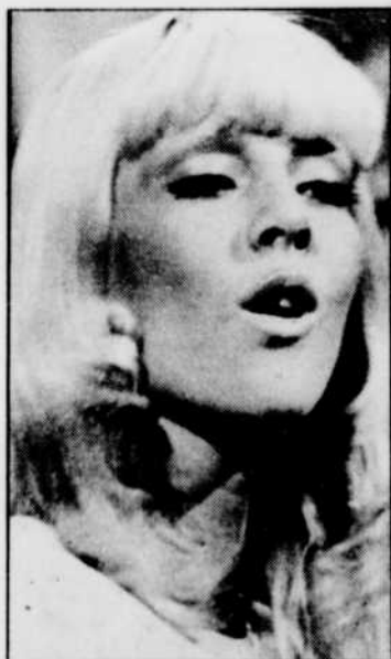
Sylvie VARTAN, invitée à «Jeunesse oblige», à 18 h 00.