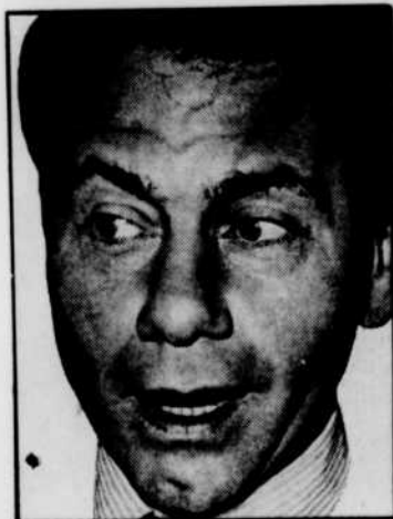
Francis LEMARQUE à «Du côté de la musique», à 14 h 00.

00 h 00—RADIOJOURNAL CBAF—FIN DES ÉMISSIONS 00 h 03—FIN DES ÉMISSIONS