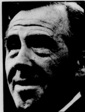
Gratién GÉLINAS à «Héros de mon enfance», à 10 h 00.