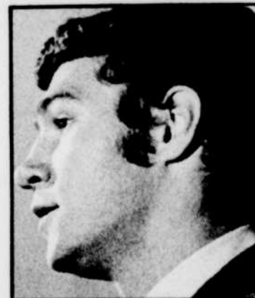
Robert CHARLEBOIS en vedette «Au fil de la nuit», à minuit.