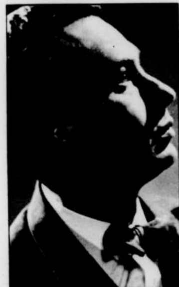
Le violoncelliste Maurice GENDRON, aux «Chefs-d'oeuvres», à 16 h 30.