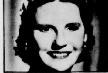
Kirsten FLAGSTAD sera entendue à «Intégrale», à 19 h 30.