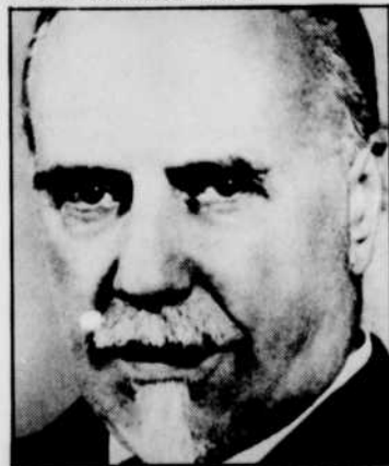
Sir Thomas BEECHAM, à «Pages Immortelles», à 19 h 30.