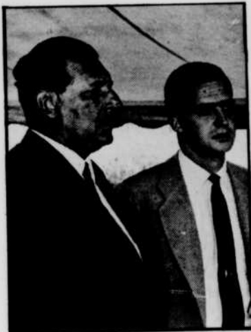
Comte de BARCELONE et DON JUAN

A l'émission les Descendants du dimanche 28 juillet à 21 h 30, nous pourrions rencontrer les membres de la très vieille et très illustre famille des Bourbons d'Espagne. L'Espagne est une monarchie sans roi, et le film a été tourné autour du trône vacant qui sera peut-être un jour restauré ou instauré et qui oppose déjà les familles Bourbons.