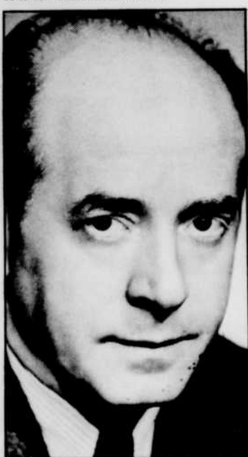
Eugène ORMANDY, aux «Chefs-d'oeuvre», LUNDI à 16 h 30.