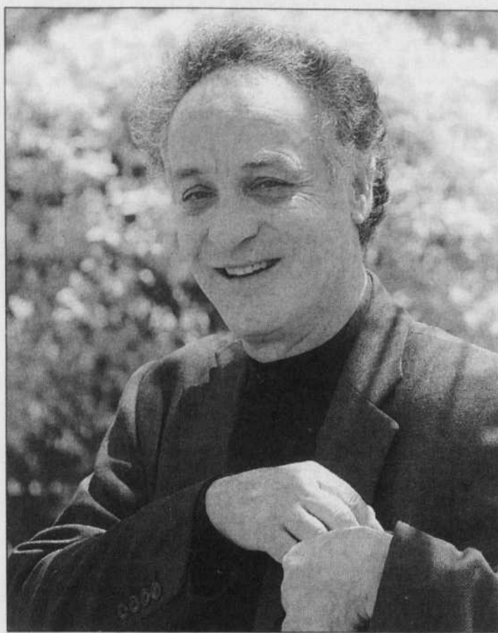
Yoav Talmi dirige l'OSQ depuis 1999.

«Lorsque je suis arrivé, en 1999, le défi était de créer un véritable équilibre au sein de l'orchestre. Certaines sections me semblaient plus fortes que d'autres. À partir de ce moment,