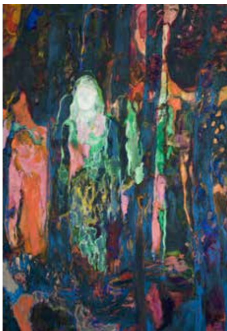
© Louis-Philippe Côté, Camp T.-S. , 2019