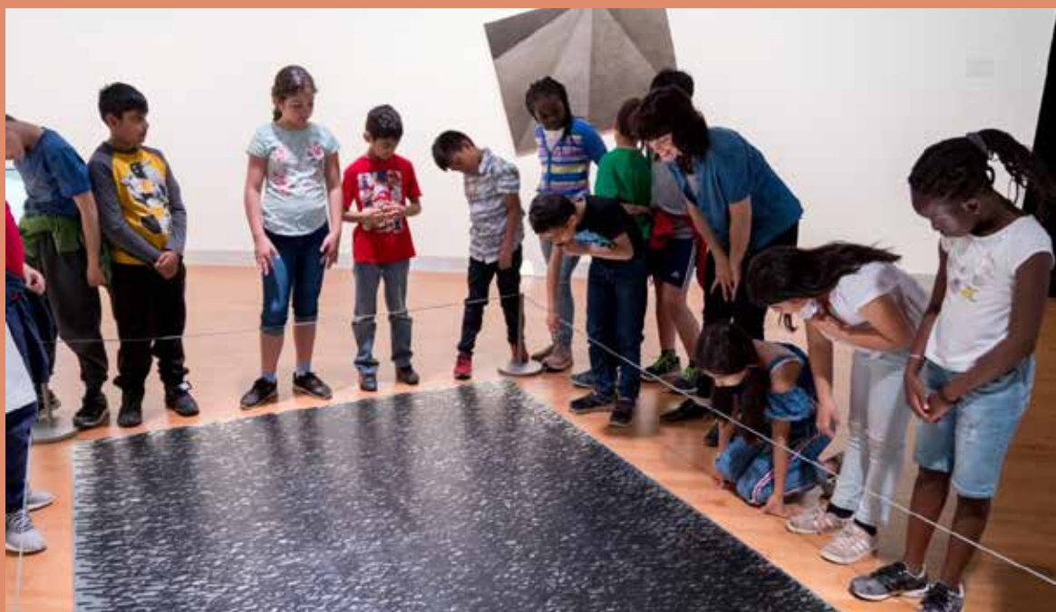
Haut : © Salle Alfred-Pellan, atelier art et science autour de l'exposition Module de survie : une écofiction de Daniel Corbeil, décembre 2018. Bas : © Jean-Michel Seminario, exposition Retentissements , juin 2019.