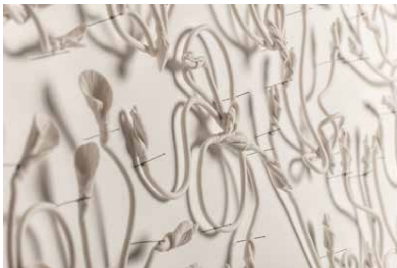
© Amélie Proulx, Les herbes de passage , 2019

La sculpture de céramique comme processus de création et phénomène de transformation (mutation) du vivant