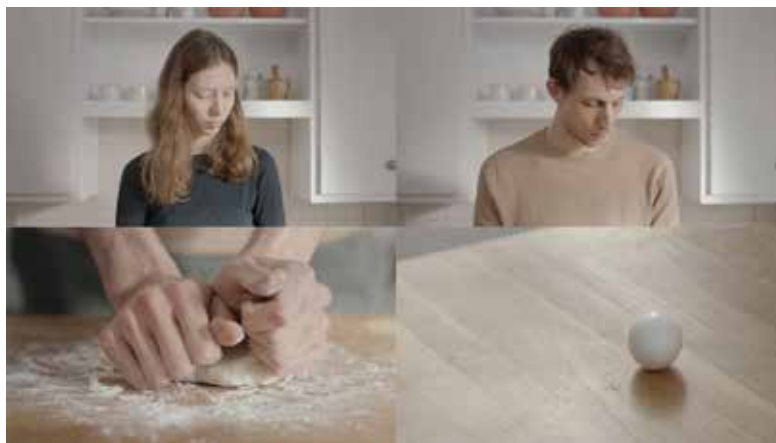
Extrait 4 écrans tirés de l'installation vidéo - Pathie d'Andrée-Anne Roussel.

Stéphanie Béliveau : objets trouvés, fusain et installation de papiers OU Jannick Deslauriers : sculpture et installation de tissus Exposition Mille-feuilles - Quand le dessin a lieu