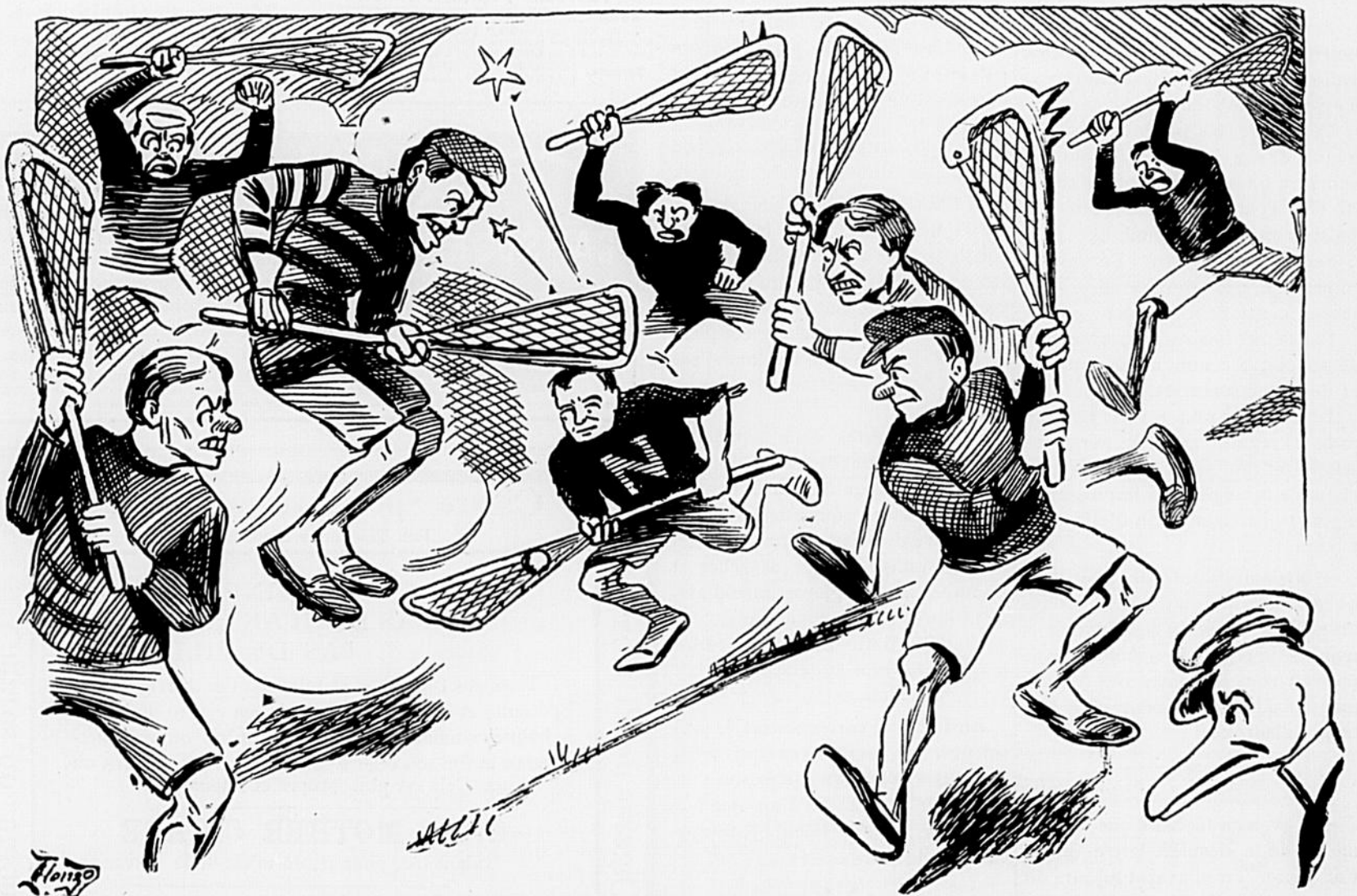
Le "Canard"—Aie! "Shamrock", vous tuez mon p'tit Gauthier. Et le referee qui est borgne.—C'est pas de la "crosse" c'est du "massacre"!!!