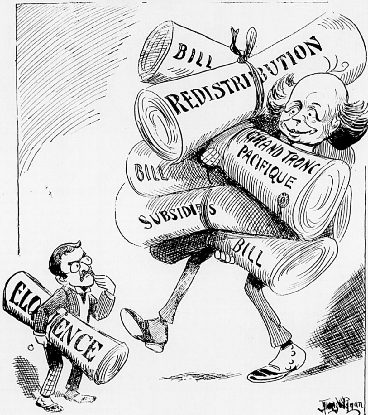
Le bagage des deux chefs de nos deux partis politiques.