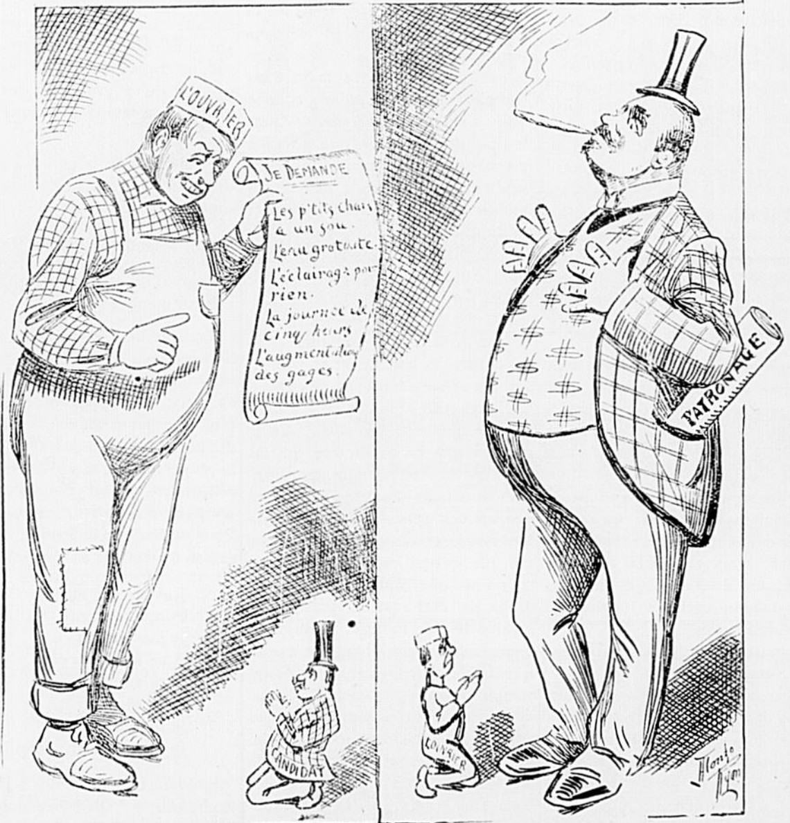
Comme les élections provinciales et municipales sont proches, nous croyons bons de soumettre cette caricature à la méditation des électeurs de la province et surtout de Montréal.