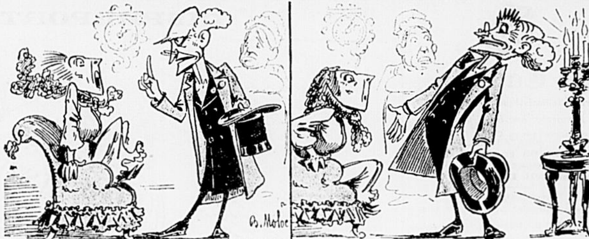
— Madame, ce que vous avez de mieux à faire à l'heure qu'il est, c'est d'envoyer chercher un notaire et un prêtre. — Docteur! Je suis perdue, je le vois bien!!!