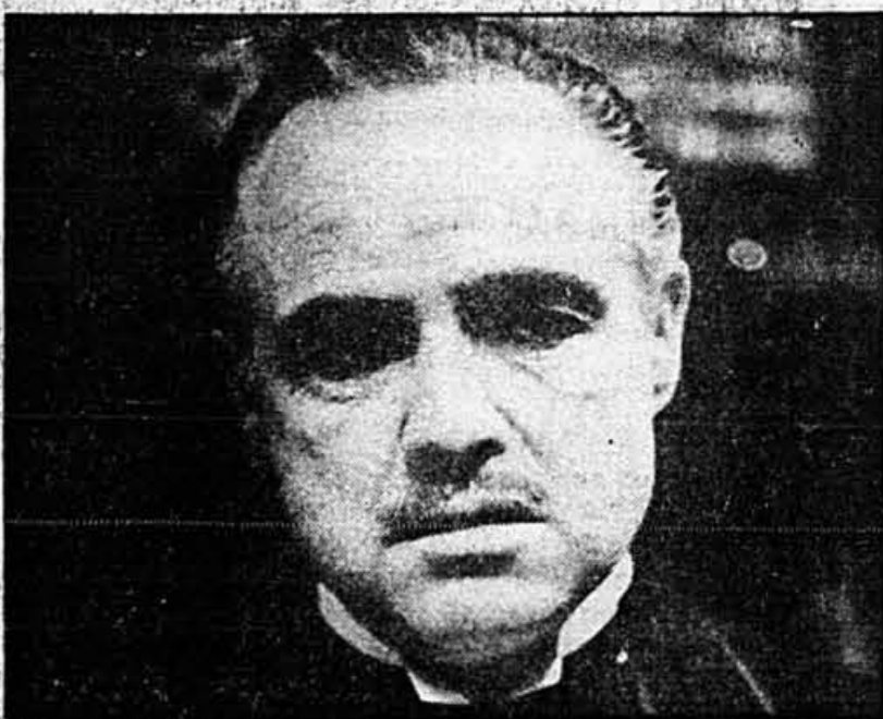
Brando dans Le Parrain .

L'acteur n'a pas annoncé ses projets d'avenir. Mais il y a fort à parier qu'une partie de sa retraite ressemblera sans doute un peu à celle prise il y a une vingtaine d'années par le chanteur Jacques Brel, parti, miné par un cancer, vivre ses dernières années dans le cadre enchanteur des Îles Marquises.