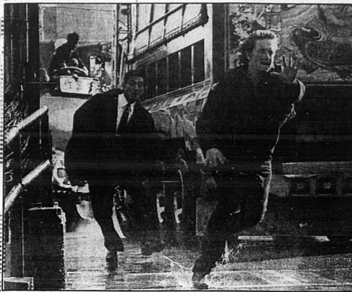
Ken Takakura et Michael Douglas dans Black Rain , du réalisateur Ridley Scott.