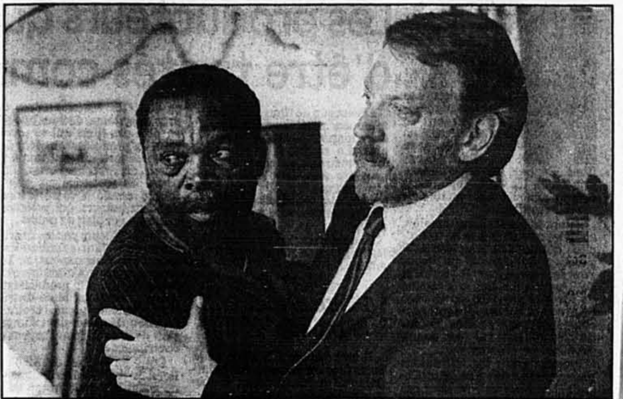
Zakes Mokae et Donald Sutherland dans A Dry White Season

Marlon Brando lui-même a assumé le rôle d'un K.O. «technique». Soyons plus cléments et pardonnons, parce que, pour le fond et l'art des comédiens, A Dry White Season mérite certainement d'être vu. Deux fois!