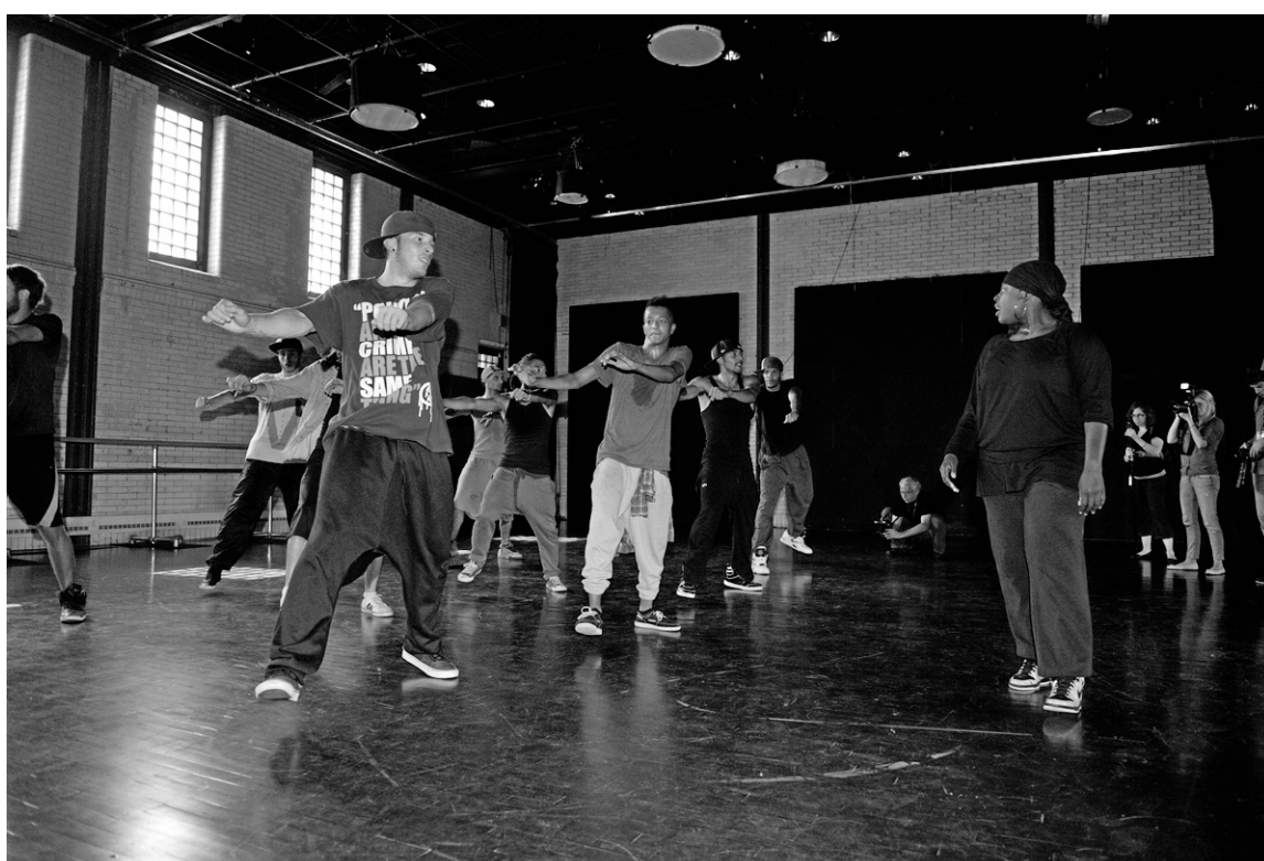
Les 10 jeunes d' Ils dansent resteront de la partie jusqu'à la fin, contrairement à d'autres séries où des candidats sont éliminés. Reste à voir si le public embarquera malgré cette absence de suspense.

Ils dansent , c'est en fait un gros camp d'entraînement.