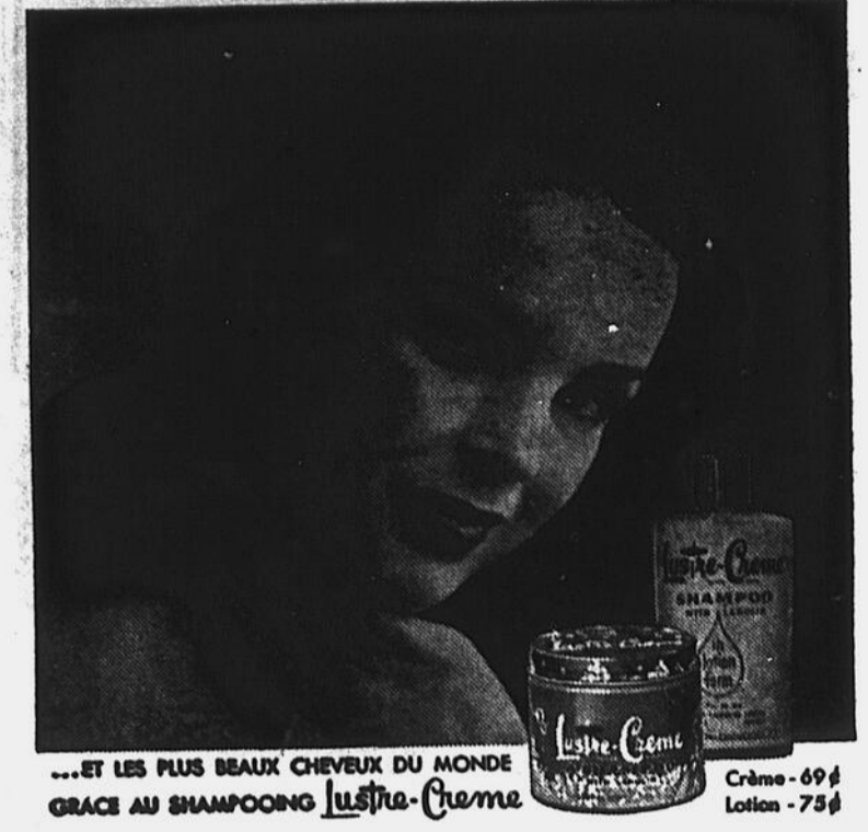
...ET LES PLUS BEAUX CHEVEUX DU MONDE GRACE AU SHAMPOING Lustré-Crème Crème - 69¢ Lotion - 75¢