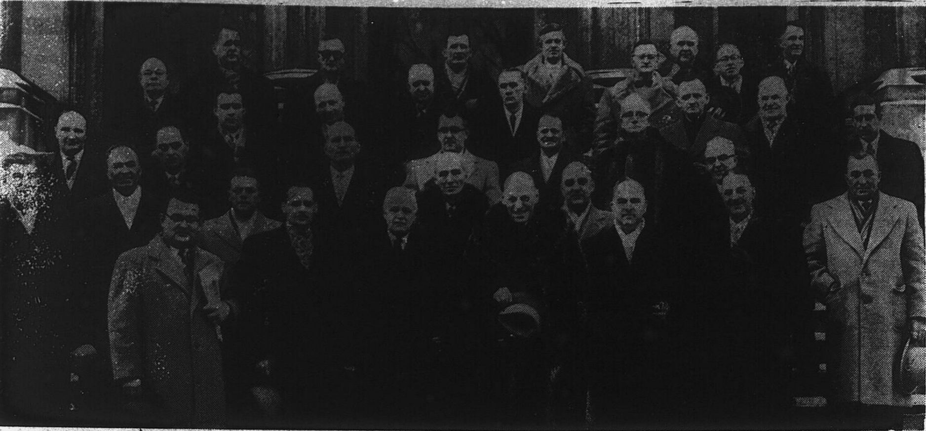
Le groupe comprenait des préfets de comté, des maires, des ingénieurs forestiers, des industriels et des cultivateurs intéressés à la cause forestière.