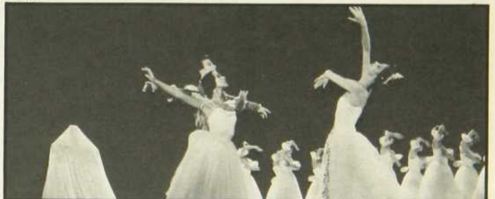
Le Réveil de Flore