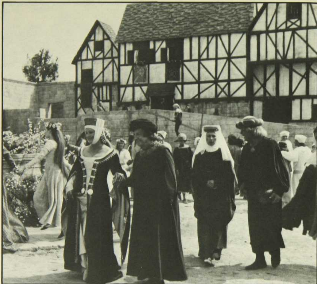
À Hors série début de la Chambre des dames (article page 7)