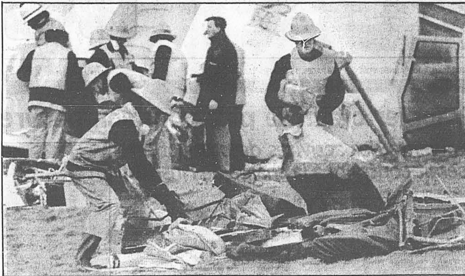
Des sapeurs font un tas des débris qu'ils viennent de retirer de l'avant du Boeing de la Pan Am qui s'est écrasé mercredi en Ecosse. Les recherches se poursuivent pour retrouver les corps d'une centaine des victimes, dont les restes sont devenus méconnaissables.