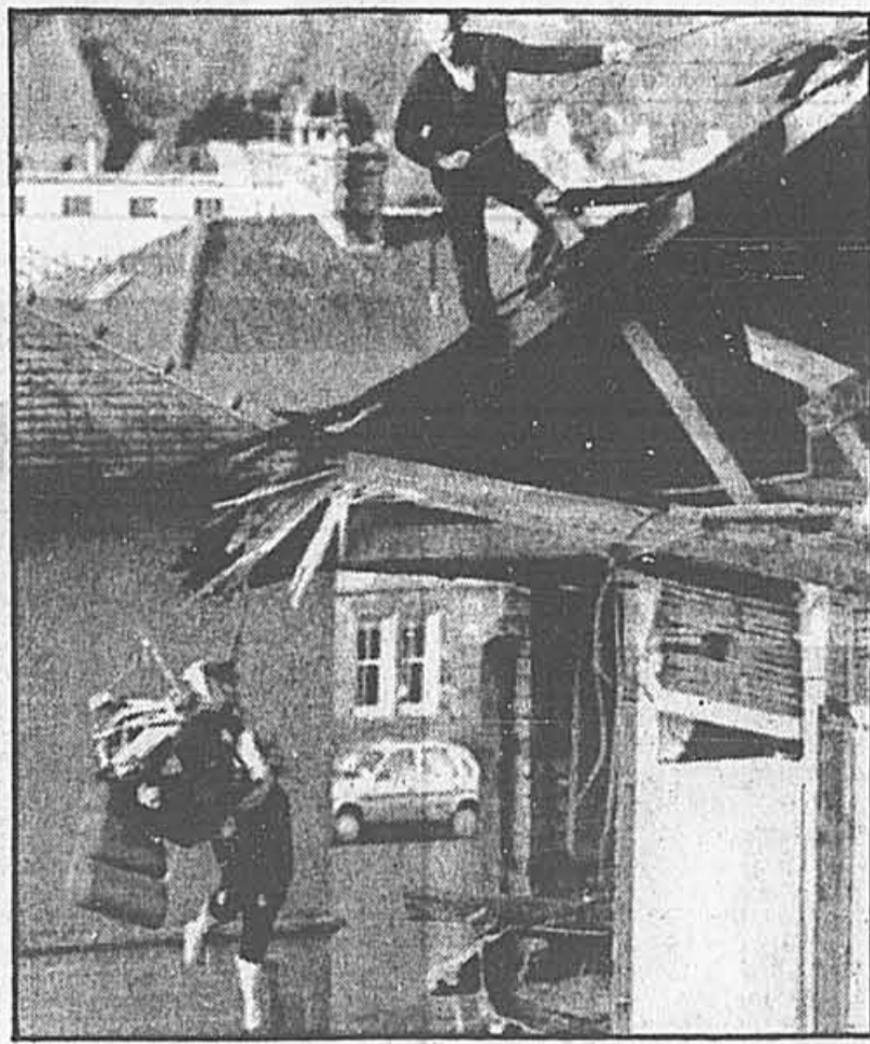
Un sauveteur descend le corps d'un passager encore attaché à un siège du Boeing 747 qui s'est abattu sur le village écossais de Lockerbie, faisant 275 victimes, dont 258 passagers et membres d'équipage, et 17 personnes au sol.