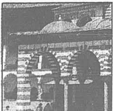
I1 8 000 ans de civilisation