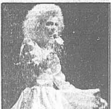
G1 Starmania: un succès colossal!