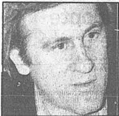
C1 Un macho qui a des failles!