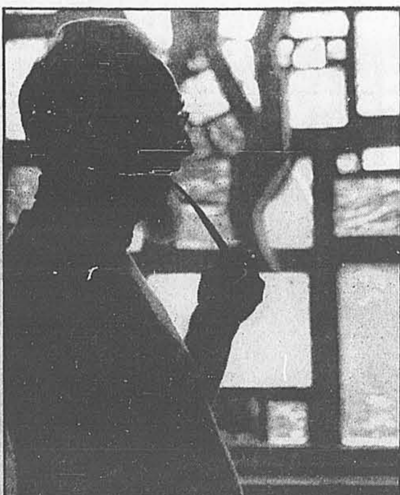
À la Maison Vinet, des prêtres et des religieux parviennent à se situer correctement parce qu'ils prennent le temps nécessaire pour le faire.