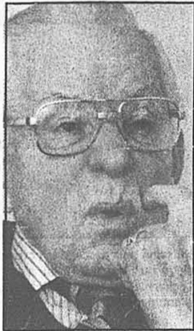
M. Armand Frappier