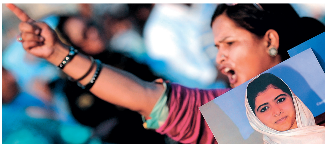
La jeune militante Malala Yousufzai a été atteinte d'une balle dans la tête lors d'une attaque perpétrée par les talibans en plein jour mardi, alors qu'elle sortait de son école.

Les talibans promettent de tuer Malala si elle survit à ses blessures. Un porte-parole a diffusé un communiqué affirmant que c'est une obligation de tuer quiconque mène campagne contre la loi islamique. Bien sûr, quelque 50 religieux ont condamné les auteurs de l'attentat. Et un ex-ministre des affaires religieuses a répliqué aux talibans que l'islam juge «le meurtre d'un innocent comme le meurtre de toute l'humanité». Mais le problème est d'ordre politique plus que religieux.