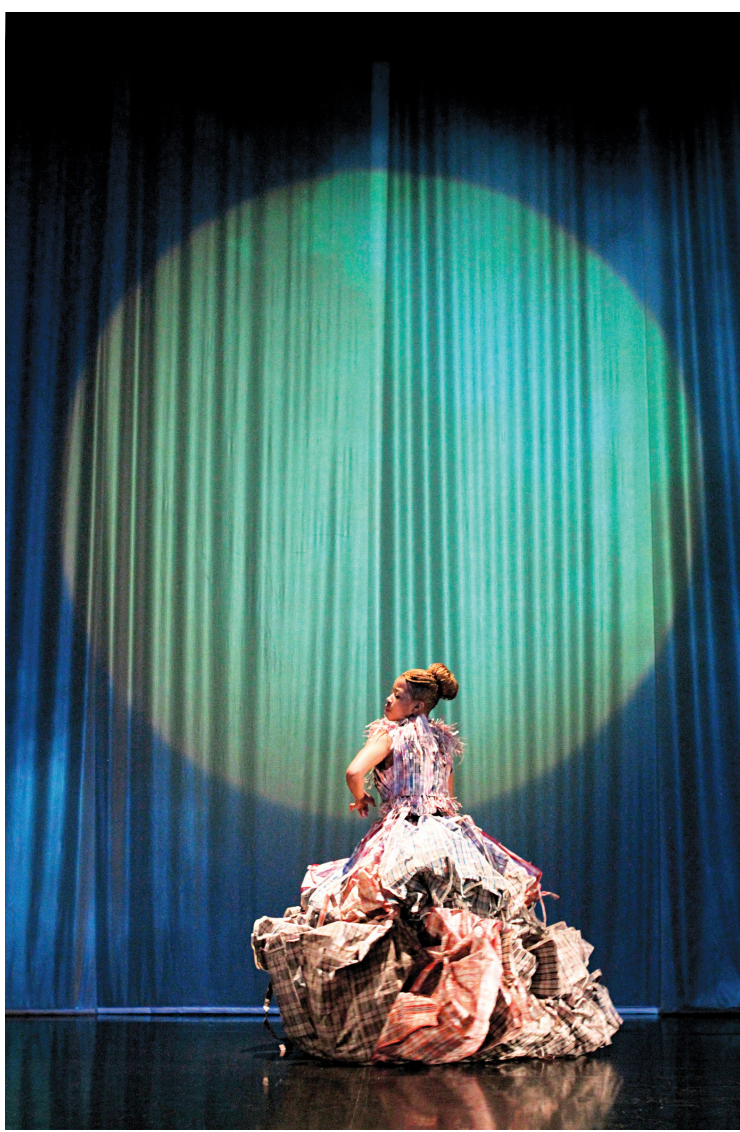
La pièce Beauty Remained... , de la chorégraphe Robyn Orlin, met entre autres en scène une reine de la «récup».

«La beauté n'est pas là où on l'attend», affirme la chorégraphe en entrevue au Devoir . Elle est dans la manière des