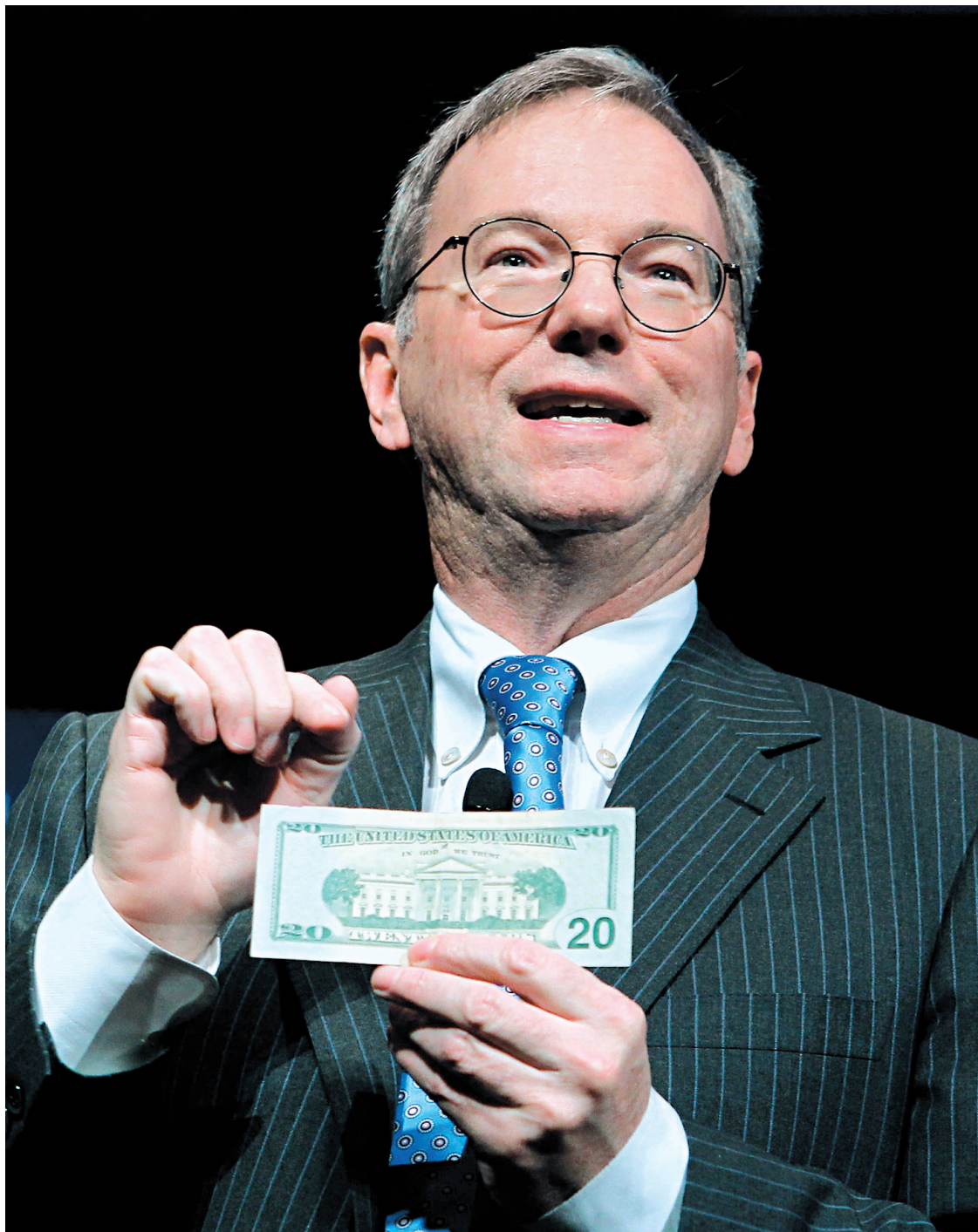
Le grand patron de Google, Eric Schmidt, a admis que « le droit fiscal international gagnerait très vraisemblablement à être réformé ».

En cause notamment la position de l'Irlande, régulièrement accusée de faire le jeu des multinationales en proposant un impôt sur les sociétés particulièrement bas, de seulement 12,5% alors que la moyenne dans la zone euro est de 23%. « En Irlande, nous ne faisons pas de montages fi-