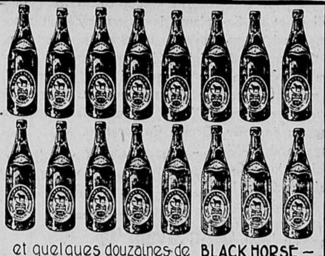
et quelques douzaines de BLACK HORSE —