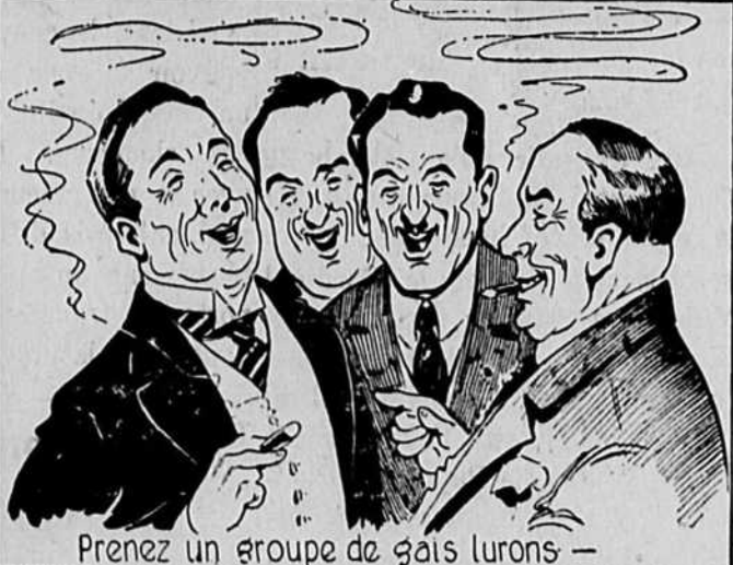
Prenez un groupe de gais lurons —