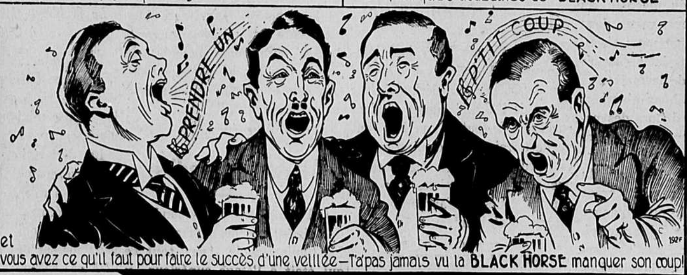
et vous avez ce qu'il faut pour faire le succès d'une veillée — T'apas jamais vu la BLACK HORSE manquer son coup!

Dites simplement — "Bière BLACK HORSE Dawes, S.V.P."