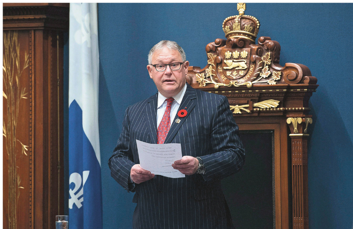
Le président de l'Assemblée nationale, Jacques Chagnon, a été longuement ovationné par l'ensemble des députés après sa mise au point.

Pour l'ex-policier de la Sûreté du Québec, cette «tentative d'intimidation sans précédent» de l'équipe du commissaire de l'UPAC, Robert Lafrenière, constitue ni plus ni moins une attaque frontale contre la démocratie québécoise. Il s'agissait de sa première intervention depuis son arrestation par l'UPAC. «Les faits qui me sont reprochés n'ont aucun fondement», a-t-il insisté lors d'une allocution de moins de 4 minutes 30 secondes prononcée depuis le fond du Salon bleu, où les élus indépendants sont confinés.