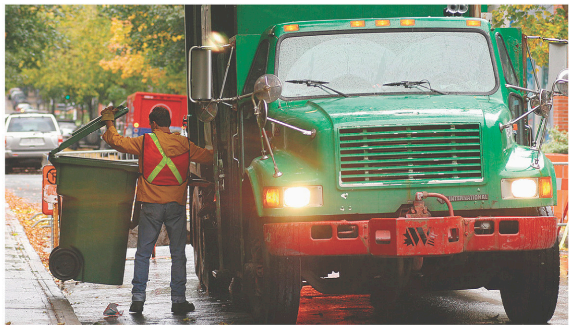
PEDRO RUIZ LE DEVOIR

Les deux organismes s'entendent pour éviter l'enfouissement des matières récupérées, même en solution temporaire.