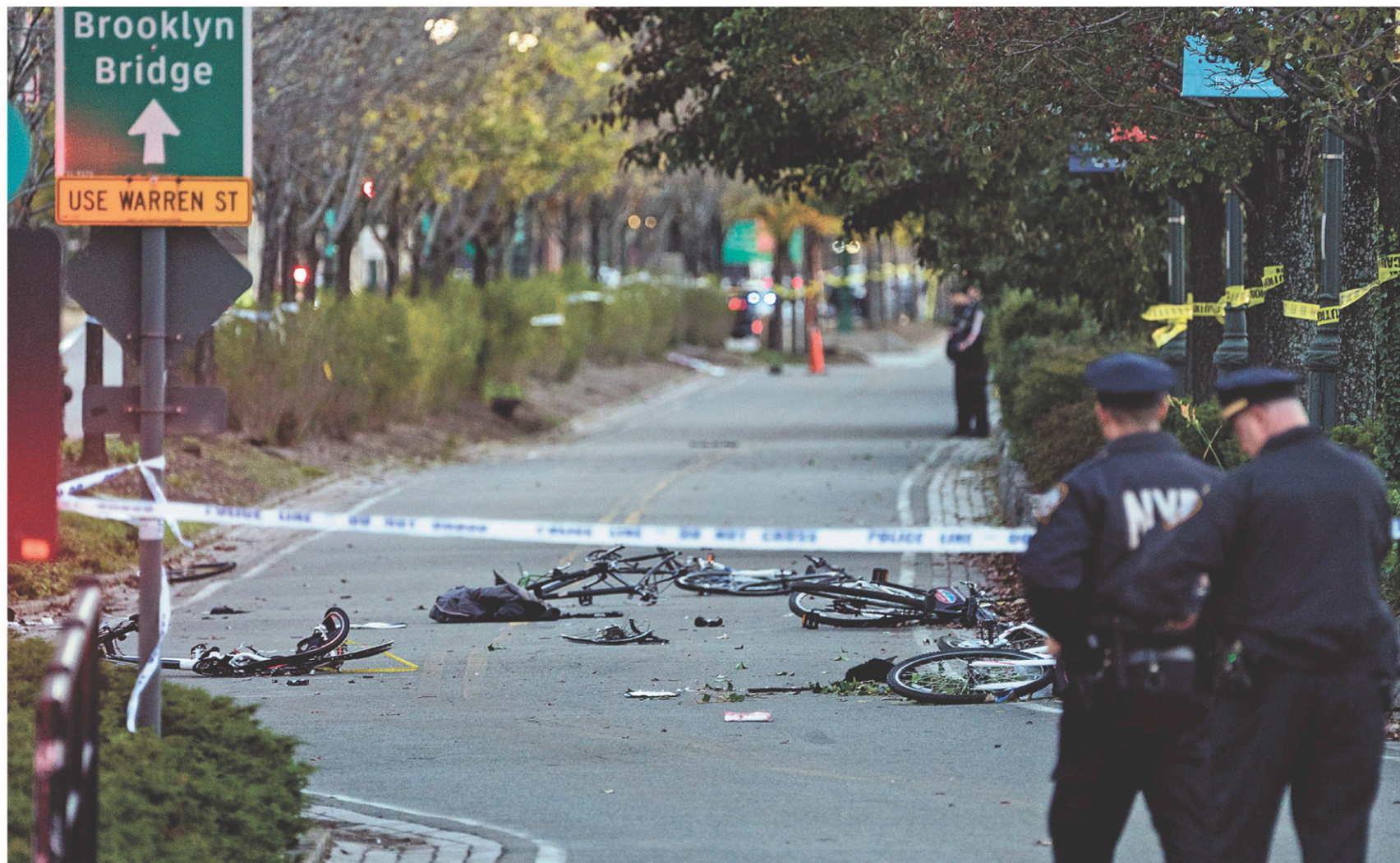
Des policiers surveillent la scène où un homme au volant d'une camionnette a volontairement fauché des cyclistes, à New York.

Le gouvernement Trudeau a pu craindre que le référendum catalan ne donne raison aux souverainistes québécois. Il vient plutôt de discréditer la voie unilatéraliste. M. Dion ne peut qu'être satisfait.