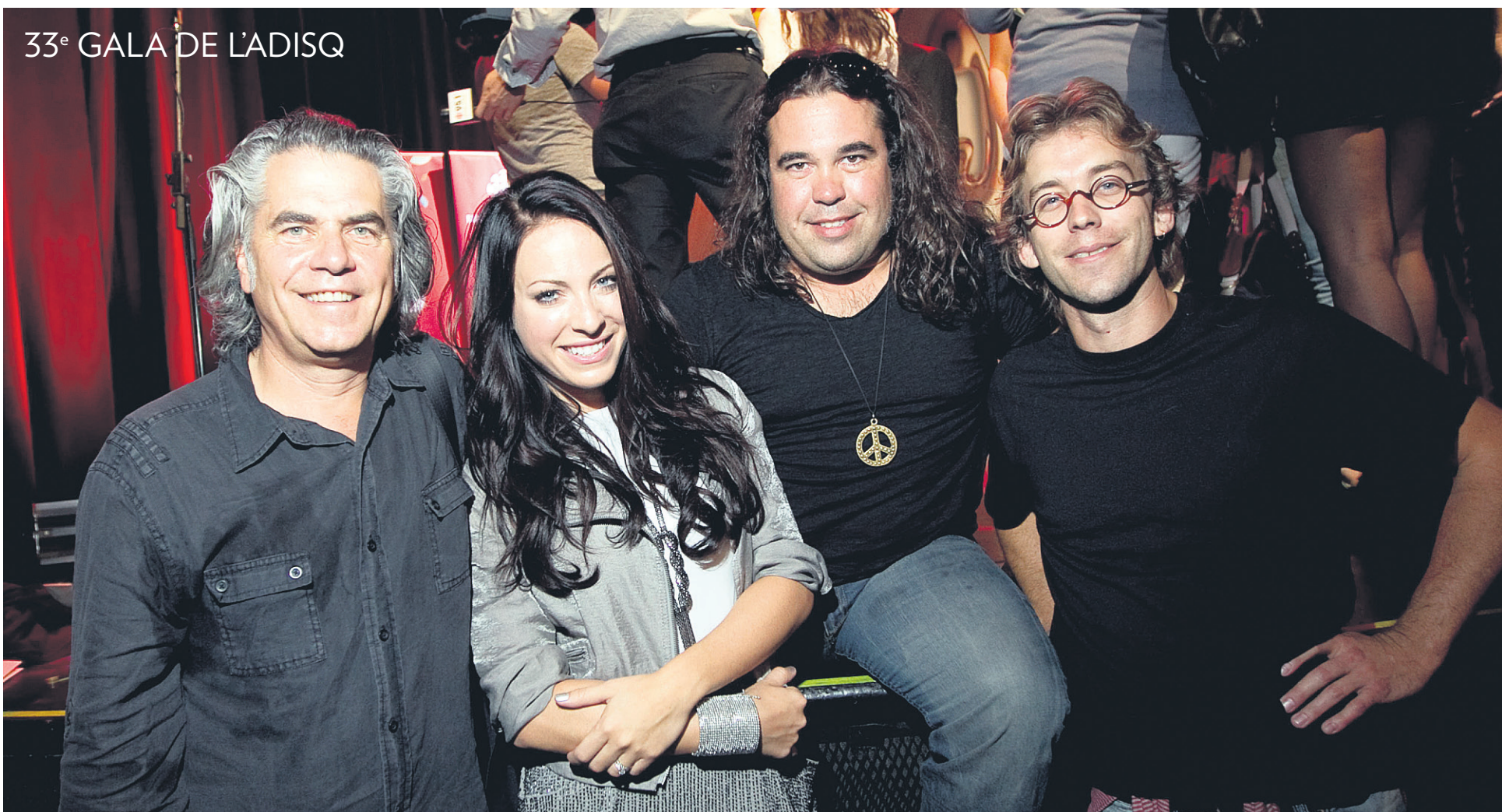
Richard Séguin, Marie-Mai, Martin Deschamps et Fred Pellerin ont tous participé à la traditionnelle photo de famille des nommés, hier.