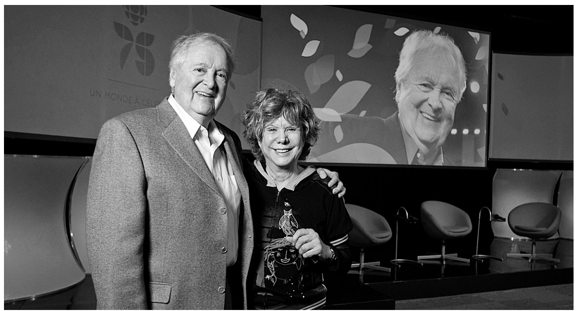
Denise Filiatrault en compagnie de Jean Bissonnette, à la projection du documentaire consacré à l'homme de télé.

Denise Filiatrault était en larmes hier midi après le visionnement de presse du documentaire Le show-business québécois: du big bang à aujourd'hui , qui retrace la fructueuse carrière du producteur, réalisateur et metteur en scène Jean Bissonnette, responsable notamment des succès de Moi et l'autre , La petite vie , Un gars une fille , Les couche-tard et Appelez-moi Lise . « C'est toute notre vie, ça », répétait Denise Filiatrault, alias la Grand Jaune, en s'épongeant les yeux.