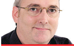
MARC-ANDRÉ LUSSIER ENVOYÉ SPÉCIAL TORONTO

Bénéficiant déjà d'une rumeur favorable venue de Locarno, Monsieur Lazhar s'est fait voir au Festival de Toronto. Qui l'a adopté à son tour.