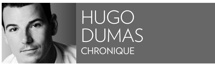
HUGO DUMAS CHRONIQUE