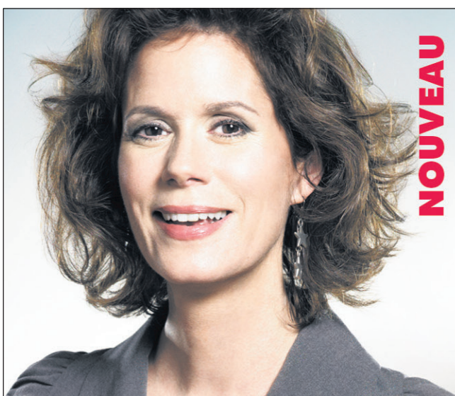
Nelly Arcan, lors de son passage à l'émission Tout le monde en parle .