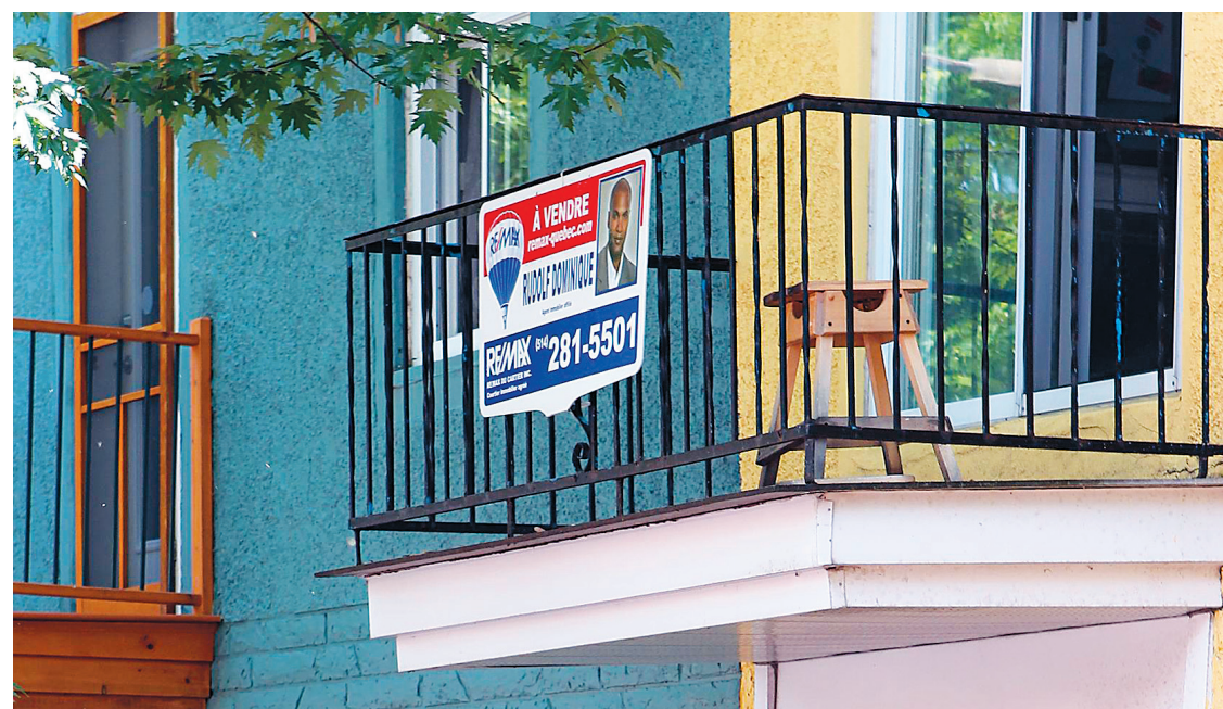
JACQUES GRENIER LE DEVOIR

Au Japon, l'acheteur d'une maison paie 34,6 % moins cher que la valeur de la propriété