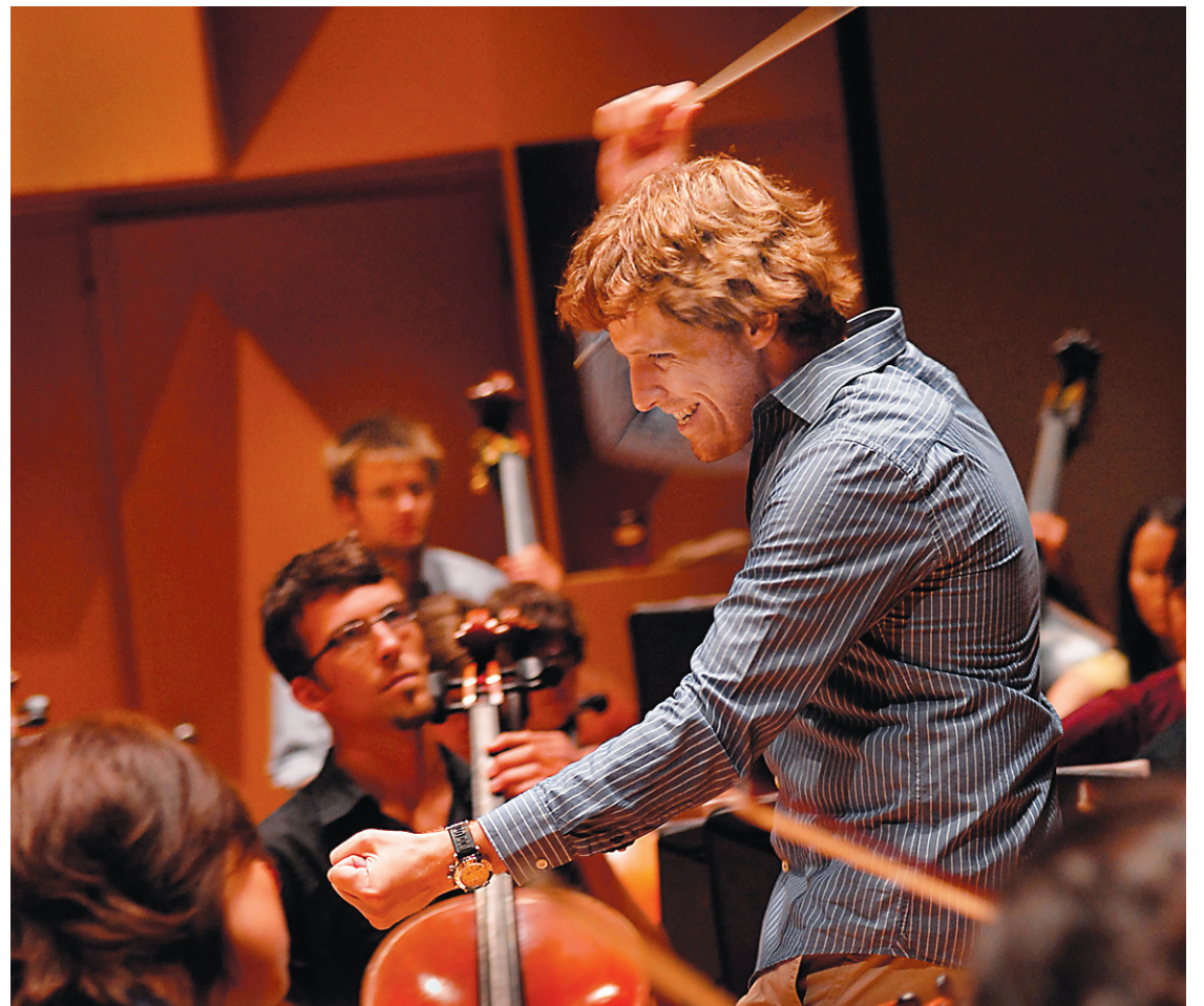
JEUNESSES MUSICALES DU CANADA