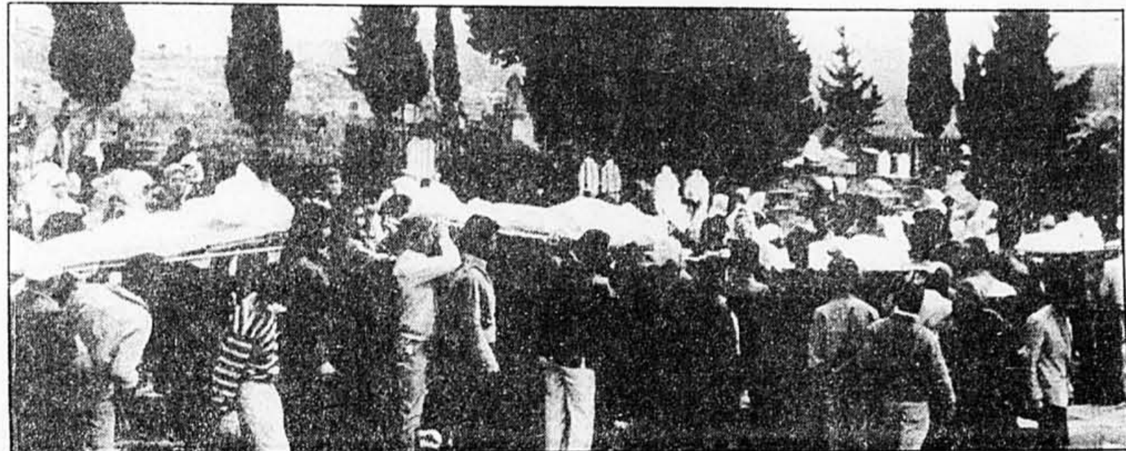
Les habitants d'un village du Sud-Liban conduisent au cimetière les corps de victimes de l'opération de ratissage effectuée la veille par les forces israéliennes.