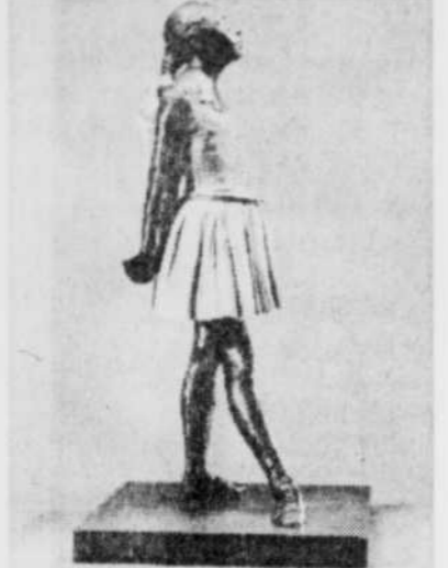
«Petite danseuse de 14 ans», une sculpture en bronze datant de 1881.

« Degas », rétrospective du peintre français Edgar Degas (1834-1917). Au Musée des beaux-arts du Canada, 380 Promenade Sussex, Ottawa. Jusqu'au 28 août. Ouvert du mercredi au vendredi de 10h à 20h, et du samedi au mardi de 10h à 18h. Les billets (qui permettent également de visiter les collections du musée) sont vendus pour une date et une heure données. Adultes: $6. Aînés et étudiants: $5. Moins de 16 ans: entrée libre. Acoustiguide: $3. Renseignements: (613) 990-1234. Commandes téléphoniques: (613) 563-1144 (Uniticket). Commandes postales: Billets Degas, 100 rue Melcalfe, bureau 201, Ottawa, Ont. K1P 5M1.