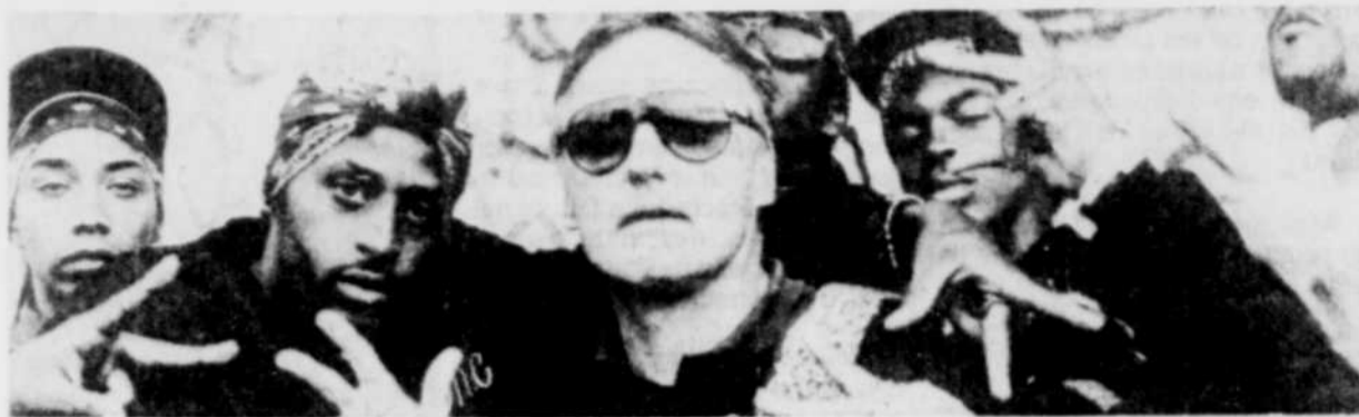
Le réalisateur Dennis Hopper est entouré de « vrais » membres des « Crips ». Les gestes qu'ils font sont en fait un langage codé.

COLORS , drame policier réalisé par Dennis Hopper. Prod.: Robert Solo (Orion). Scén.: Michael Schiffer et Richard Dilleo. Phot.: Haskell Wexler. Mus.: Herbie Hancock. Int.: Sean Penn (McGavin), Robert Duvall (Hodges), Maria Conchita Alonso (Louisa), Trinidad Silva (Frog). États-Unis, 1988, 117 min. En version française au Cinéplex Charest.