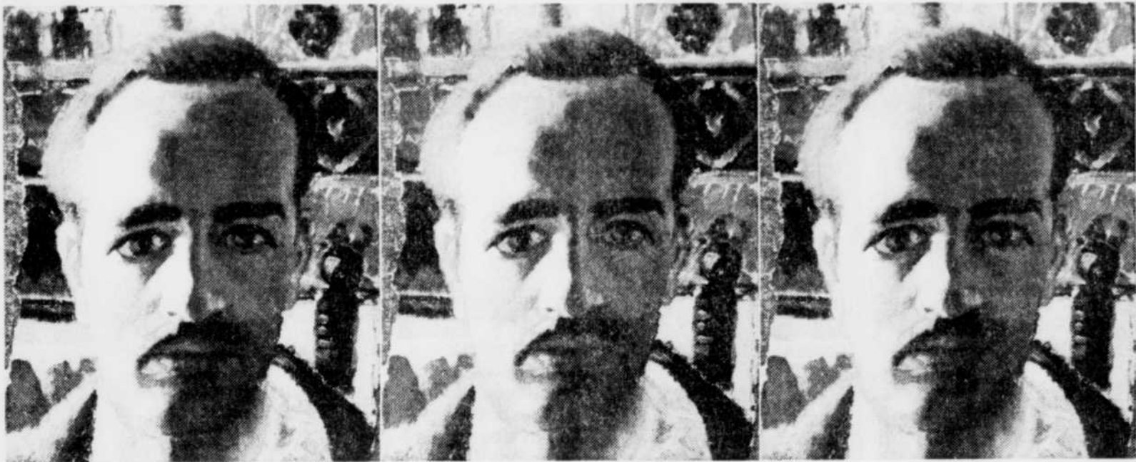
Autocollant, 1938. Musée des Beaux-Arts de Montréal, Ottawa