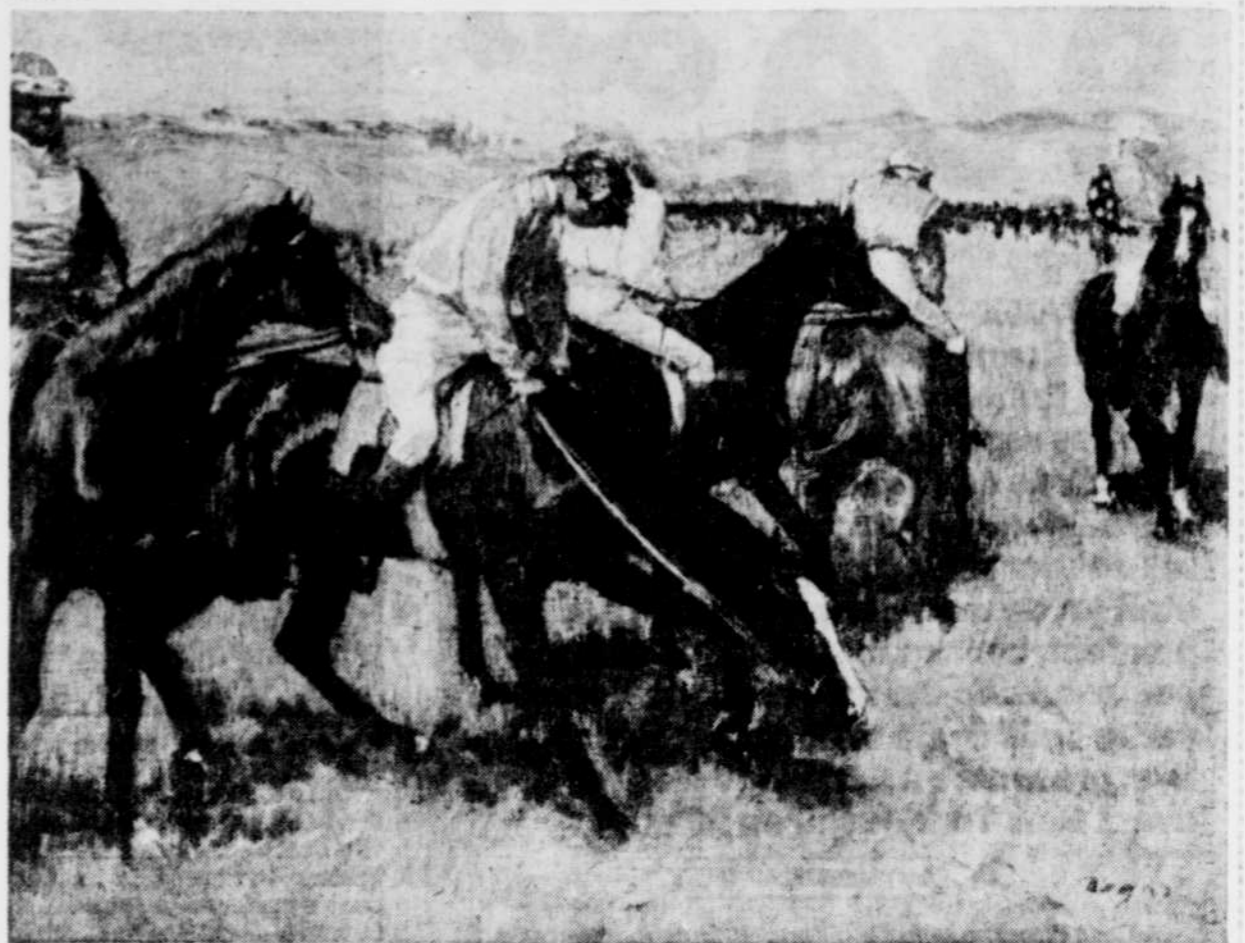
«Avant la course», une des nombreuses huiles sur toile de Degas ayant pour thème les courses de chevaux.

Il paraissait déjà évident qu'une visite à Ottawa s'imposait cet été, en raison du nouvel édifice du Musée des beaux-arts du Canada. L'exposition Degas vient, si besoin était, confirmer l'impératif de cette destination culturelle. ●