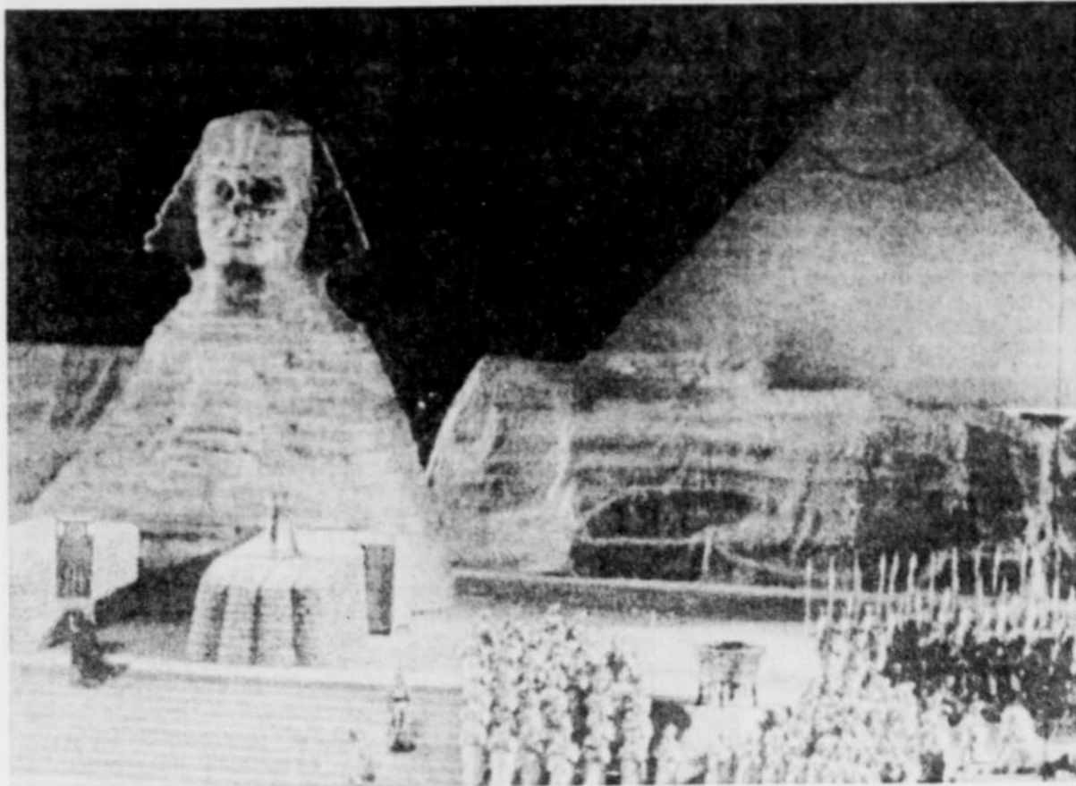
Lors de la première, jeudi, il se trouvait près de 30,000 personnes venues voir ce que pouvait donner l'un des plus populaires ouvrages lyriques de Verdi dans un stade principalement voué au baseball.

seulement sur des scènes spectaculaires. Il en est d'autres à caractère franchement intime: telles la confrontation entre Amneris et Aïda au début du 2e acte, la merveilleuse scène du Nil (sommet incontesté de l'ouvrage) et le tableau final.