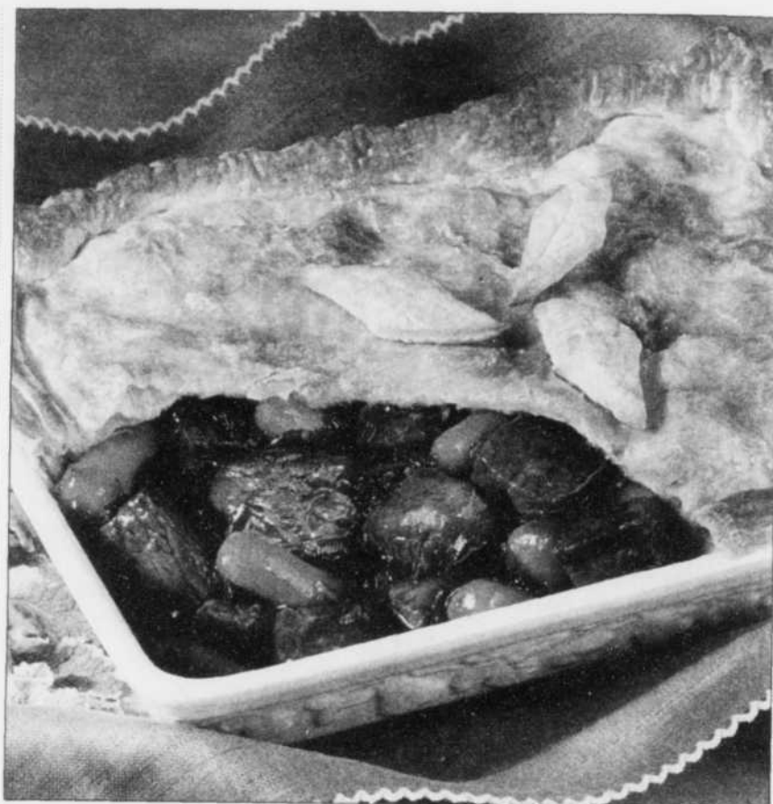
CENTRE D'INFORMATION SUR LE BOEUF

casserole en acier. Déposer cette dernière sur un feu doux et faire fondre le chocolat en remuant avec une spatule de bois. Lorsque le chocolat est fondu, transférer le contenu dans le caquelon à fondue. Allumer le lumignon et que le dessert commence. Variation 1: Vous pouvez mettre un peu moins de lait évaporé et incorporer une liqueur de votre choix (crème irlandaise, Tia Maria, etc.). Variation 2: Vous pouvez ajouter quelques guimauves miniatures à la fondue et des amandes émincées légèrement grillées. Source: Trudeau