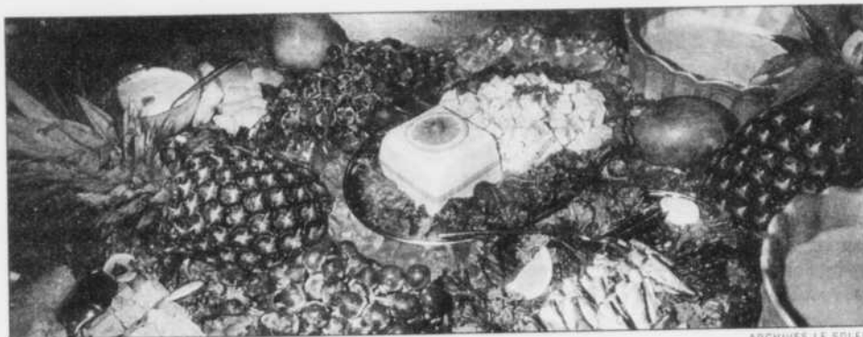
Gardez les aliments froids au frais en posant les plats de service sur de la glace concassée.

Quand on se déplace avec des aliments, il faut garder les aliments chauds au chaud et