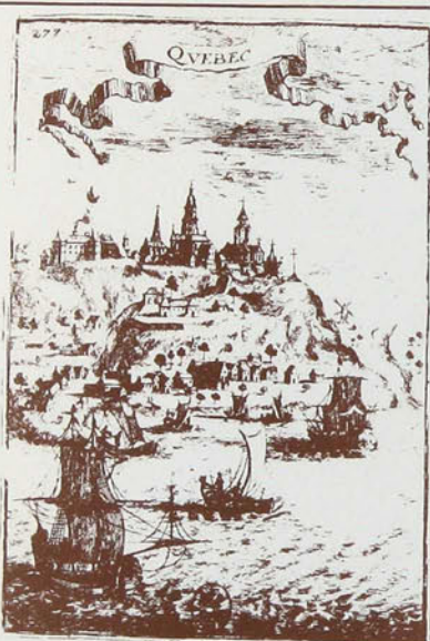
Bibliothèque Nationale du Québec