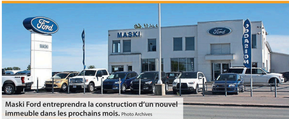
Maski Ford entreprendra la construction d'un nouvel immeuble dans les prochains mois.