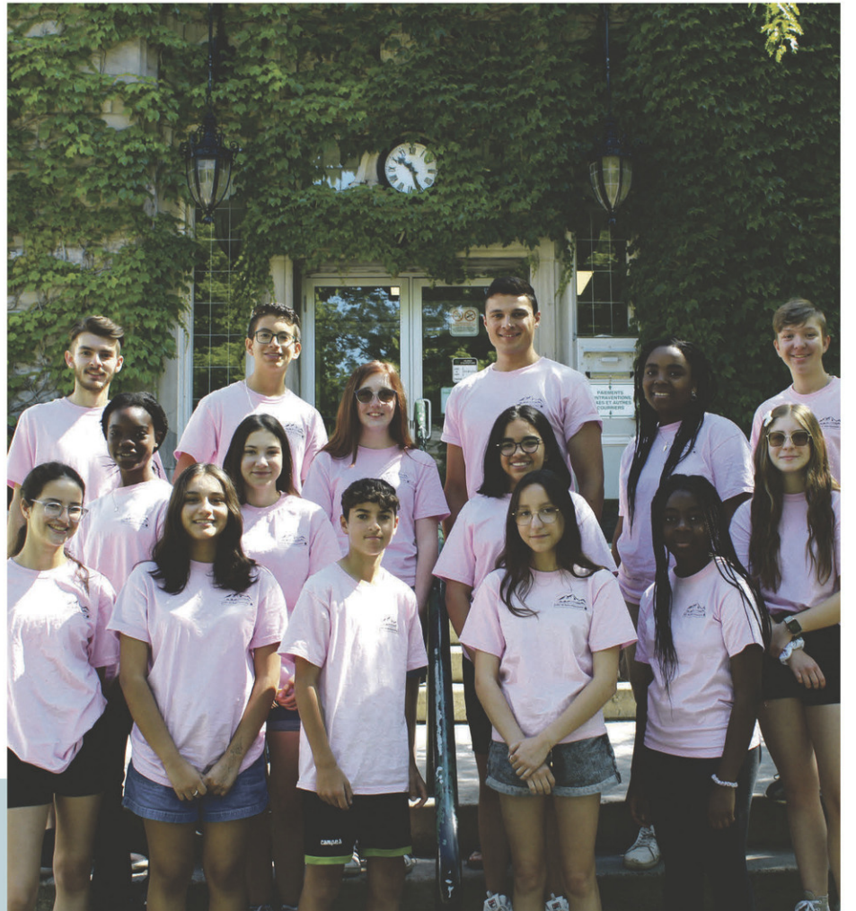
Les jeunes coopérants de la 22 e édition de la Coop d'initiation à l'entrepreneuriat collectif.

Ce projet annuel est rendu possible grâce au soutien des partenaires et d'un comité local formé de collaborateurs du milieu. Il est soutenu par le Fonds étudiant II qui, à titre de partenaire financier majeur, assure notamment le salaire et la formation des coordonnateurs partout au Québec. Il est déployé avec la collaboration du service d'entrepreneuriat coopératif du Conseil québécois de la coopération et de la mutualité, soutenu financièrement par le Secrétariat à la jeunesse, la Fondation pour l'éducation à la coopération et à la mutualité et le Mouvement Desjardins. Le projet bénéficie aussi du soutien de la Caisse Desjardins de la Région de Saint-Hyacinthe et de Services Canada via son programme Emplois d'été Canada.