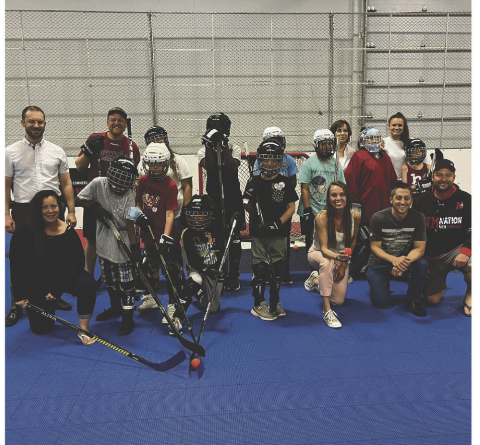
En prévision du tournoi de dek hockey cet automne au profit du Centre de pédiatrie sociale Grand Galop, l'équipe de l'organisme et des partenaires se sont réunis pour initier une dizaine de jeunes à ce sport qui gagne en popularité.

Pour obtenir plus d'informations ou mentionner son intérêt à se joindre à l'organisation : dg@grandgalop.ca.