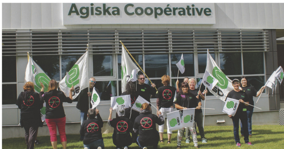
Des employés d'Agiska Coopérative ont manifesté devant le siège social.