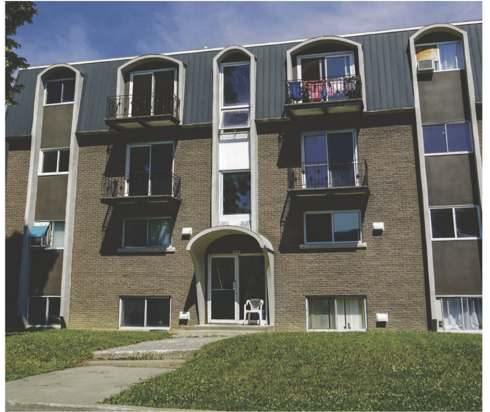
L'un des deux bâtiments concernés par la poursuite, appartenant à la Cité Immobilière, une société de noms collectifs possédant plusieurs immeubles à Saint-Hyacinthe.

Selon le directeur général de la Ville, il pourrait y avoir d'autres bâtiments dans la même situation sur le territoire de Saint-Hyacinthe. C'est pourquoi la Municipalité compte utiliser une disposition de la Loi sur le bâtiment pour empêcher que les propriétaires engagent des recours contre elle. Saint-Hyacinthe se prépare en effet à revoir sa réglementation en matière de protec-