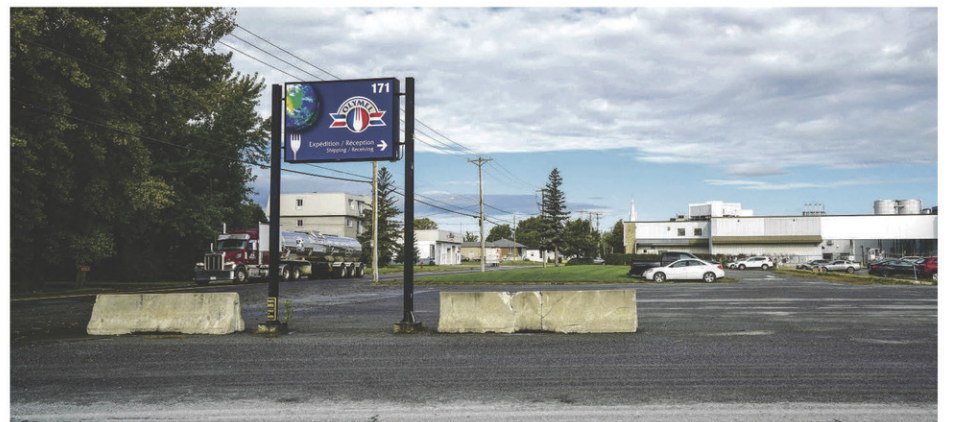
La Municipalité de Saint-Simon désire acquérir l'usine d'Olymel sur son territoire pour en faire un développement immobilier.