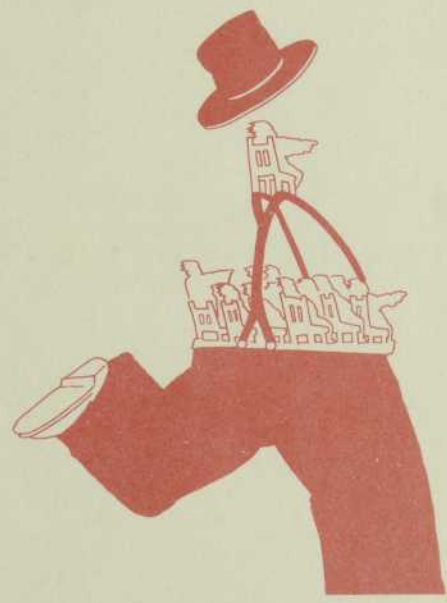
— dessin de Tibo pour la campagne de financement —

Une association en santé est une association qui se développe, qui progresse et qu'on reconnaît à ses réalisations concrètes. L'AQJT a entrepris un effort de régionalisation en organisant, par exemple, des carrefours de formation; c'est précisément lors de la tenue de ces activités régionales qu'elle a pu se rendre compte avec acuité de l'urgence de répondre aux besoins des troupes qui vivent à l'extérieur des grands centres (Montréal et Québec). Pour répondre aux besoins exprimés, avec un minimum d'efficacité, l'AQJT a besoin d'argent et c'est sur tous et chacun qu'elle compte pour aller recueillir