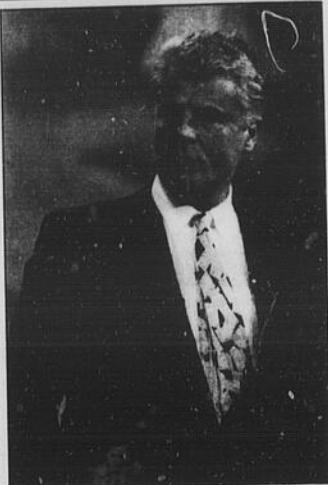
Michele Placido, regista ed interprete del film "Un eroe borghese", presente nella sezione «Competizione Ufficiale».

mondiale, data la presenza di registi di ogni angolo del pianeta. D'altra parte, la stessa idea di dividere tutti i films previsti in differenti sezioni raggiunge perfettamente le esigenze richieste dal grande pubblico di spettatori, critici e giornalisti accorsi a Montréal