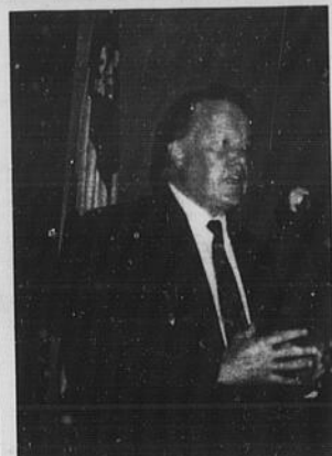
Il ministro Bernard LANDRY, mentre si rivolge ai presenti raccolti nella sala Chateaubriand di RDP per ascoltare.

Il vice primo ministro del Québec Bernard Landry, ha visitato martedì 22 agosto scorso la circoscrizione di R.D.P. Ville d'Anjou dove ha incontrato varie comunità d'affari tra le quali: l'italiana, l'ebraica, la cinese, la vietnamita, la greca, l'haitiana e diverse altre, che si erano date appuntamento in una sala di ricevimenti della città per incontrare il ministro delle comunità culturali e degli affari internazionali, al quale hanno presentato i progetti da loro preparati per la creazione di nuovi posti di lavoro di cui tanto si parla a tutti i livelli.