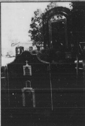
Quanti ricordi! Nella foto, l'artistica riproduzione della chiesa Madonna del Carmine a Montorio nel Frantani ed il quadro della Madonna.

Già dal primo anno i montoriesi hanno risposto con interesse a questa festa, che ha come caratteristica durante la processione la sfilata di sovrani e di carri decorati con le blonde chiove del grano.