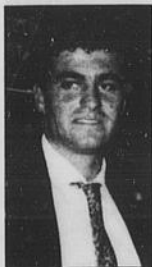
Italia - Salsomaggiore.

Salsomaggiore Terme. La serata sarà trasmessa in diretta su Raiuno, presentata da Fabrizio Frizzi. Alle prime sei concorrenti classificate saranno abbinati i biglietti vincenti della Lotteria di Miss