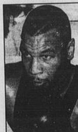
Mike Tyson si prepara per la sua prossima vittima del 4 novembre prossimo... avrà di fronte Buster Mathis (20-0-0, 6 ko), un avversario coriaceo, e poi si batterà per il titolo il prossimo mese di marzo.

Adirato dalle critiche che gli sono piovute addosso in seguito al combattimento-bidone Tyson-McNeeley del 19 agosto scorso, il promotore Don King ha affermato la scorsa settimana che Tyson sarà pronto a riconquistare il titolo mondiale dei pesi massimi al suo terzo combattimento il 16 marzo '96. Nel frattempo, gli è già stata indicata la sua prossima vittima... Difatti, il 4 novembre "The Iron" Tyson, affronterà Buster Mathis Jr. che possiede un record di 20 vittorie senza alcuna sconfitta, sei delle quali vinte per Ko. Figlio d'arte, suo padre era valdo peso massimo negli anni sessanta, fallì il suo tentativo della corona mondiale il 4 marzo 1968, al Madison Square Garden di New-York, contro Joe Frazier, che lo mandò ko alla 1ma ripresa. Il combattimento Tyson-Mathis, il 4 novembre prossimo, sarà dunque di preparazione a quello per marzo '96. Tyson, che ha scontato una pena di tre anni in prigione per stupro alla candidata a Miss America