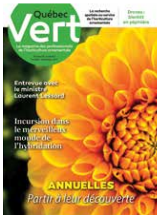
Octobre-Novembre 2017 Les nouveautés végétales

traitant de tous les secteurs d'activité de l'horticulture ornementale