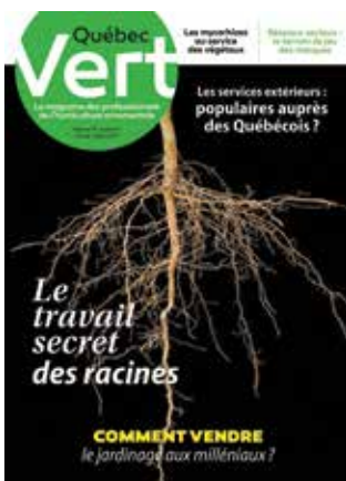
Février-Mars 2017 La force du réseau

Le site Web [ www.quebecvert.com ], le kit média et les outils promotionnels utilisés par les représentants publicitaires ont également été mis à jour.