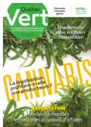
Juin-Juillet 2017 Le marché émergent du cannabis