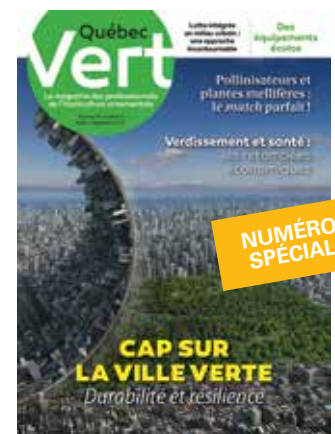
Août-Septembre 2017 Ville verte, durable et résiliente