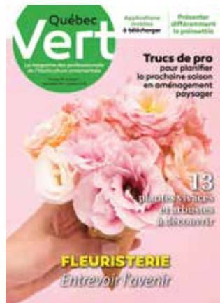
Décembre 2017-Janvier 2018 La fleuristerie