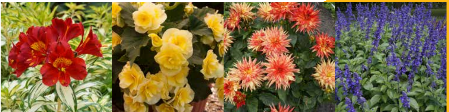
Astroemeria Rock 'n' Roll® 'AlsDun01' | Begonia hiemalis Solenia® Yellow | Dahlia 'XXL Tabasco' | Salvia Mystic Spires Improved 'Balsalmispim'