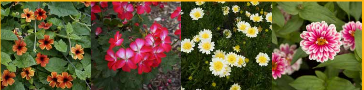
Thunbergia alata Tangerine Slice A-Peel ® 'DL1501' | Pelargonium hortorum Tango ™ Bicolor Cherry | Osteospermum Bright Lights ™ Double Moon glow | Zinnia marylandica Double Zahara ™ Raspberry Ripple 'PAS1246682'

GAGNANTES VALIDÉES PAR UN COMITÉ D'EXPERTS HORTICOLES