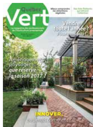
Avril-Mai 2017 L'innovation