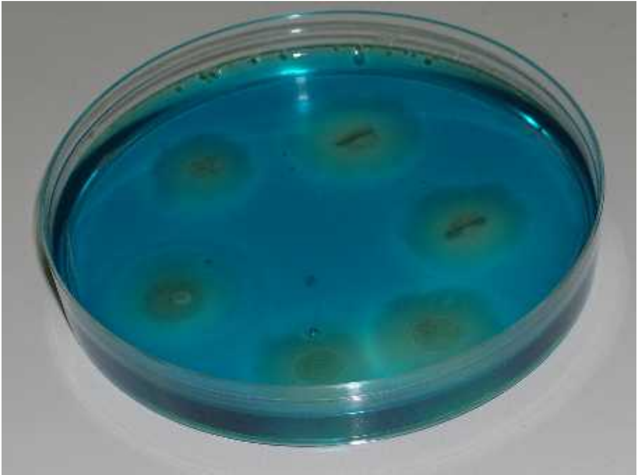
Figure 1 - Croissance d'une culture de salmonelle sur le milieu sélectif MRSV.