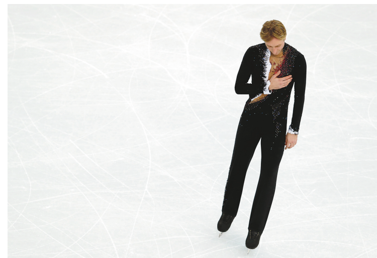
Evgeni Plushenko a pris sa retraite du patinage artistique jeudi.