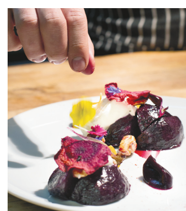
La salade de betteraves en entrée.

Je vous mets au défi de trouver mieux en ville en ce moment. On parle bien sûr de gastronomie et de moments de plénitude, pas de cirque loungesque.