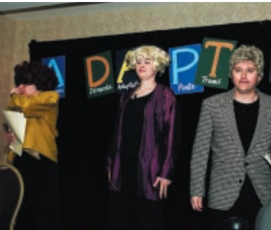
...Un « soap » à l'américaine

En l'occurrence, les décors d'un studio de télévision ont été retenus. Dans le cadre d'une émission s'appelant « Les trouvailles d'Eurêka », trois comédiens nous ont fait vivre, tour à tour, diverses émotions en nous faisant participer à un reportage en direct, un « soap » à l'américaine, des capsules de publicité, un jeu « Quiz ». Une entrevue en directe était également au programme pour présenter le « produit ».