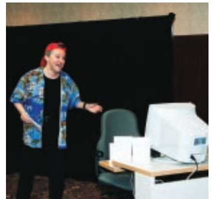
Le régisseur prépare les spectateurs

Félicitations à TAC COM qui a su réellement... s'adapter à ADAPTE pour nous offrir un produit complet, éducatif et dynamique.