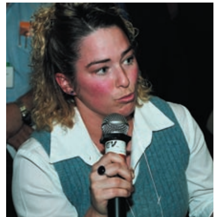
Le public était consulté

un humour que tous les spectateurs ont particulièrement appréciés.