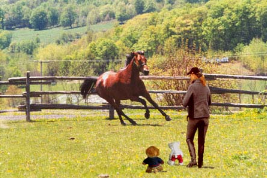
mademoiselle X, les deux mascottes ourson athlète et monsieur X et leur ami Helion de Rueire

«On ne peut pas forcer un cheval à boire... mais on peut toujours mettre du sel dans son avoine!»