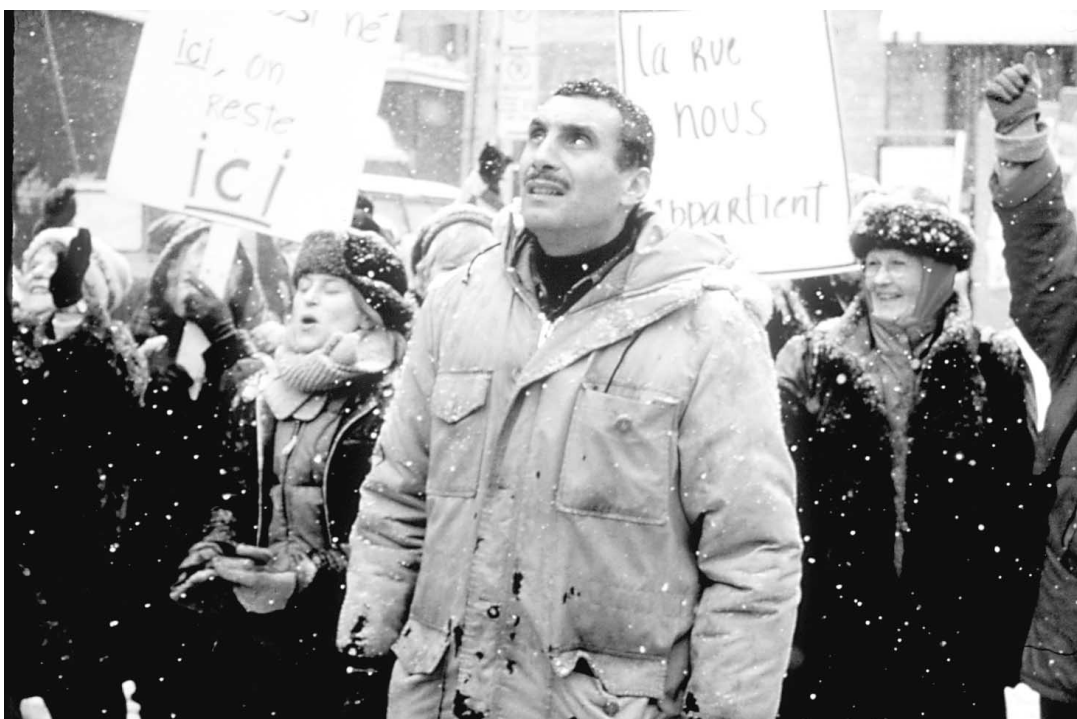
Fidèle à sa réputation, Denis Chouinard n'a pas choisi de grandes vedettes pour donner vie aux personnages de son film. « Je préfère choisir des gens peut-être moins connus mais dont l'énergie est plus brute, plus pure. »

À quelques heures de la présentation de son film L'Ange de goudron à la soirée d'ouverture du Festival des films du monde, Denis