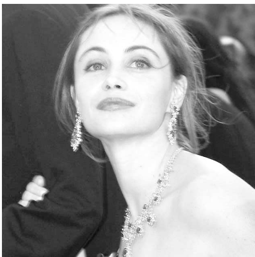
Le jury du 25 e FFM, présidé par l'actrice française Emmanuelle Béart (ci-dessus), fera sa première apparition ce soir, 19 h, à l'occasion du traditionnel défilé VIP.

En plus des projections à la belle étoile, on propose aux Montréalais de la musique du monde, un jeu questionnaire, de la peinture en direct, de la danse et du théâtre. Des amateurs de rue et autres jongleurs ont été engagés pour amuser les petits et des bouquinistes installeront leurs kiosques aux abords de la Place des Arts. Kusturica et son orchestre sont aussi de retour, deux soirs, les 25 et 26 août. Le 2 août, le groupe cubain Los Van Van occupe la scène, la veille de la projection