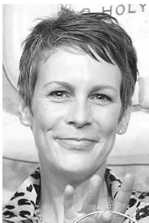
Jamie Lee Curtis

Un classique de Sergio Leone, avec Clint Eastwood, Lee Van Cleef et Eli Wallach. La scène dans le cimetière, sur musique de Morricone, est un chef-d'oeuvre.