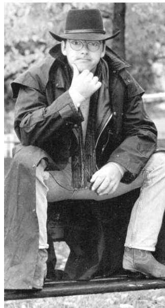
Gildor Roy se produit à l'Hippodrome ce soir, 21 h 15.

Le 100,7 FM se rebranche en grand sur la culture également le 27 août.