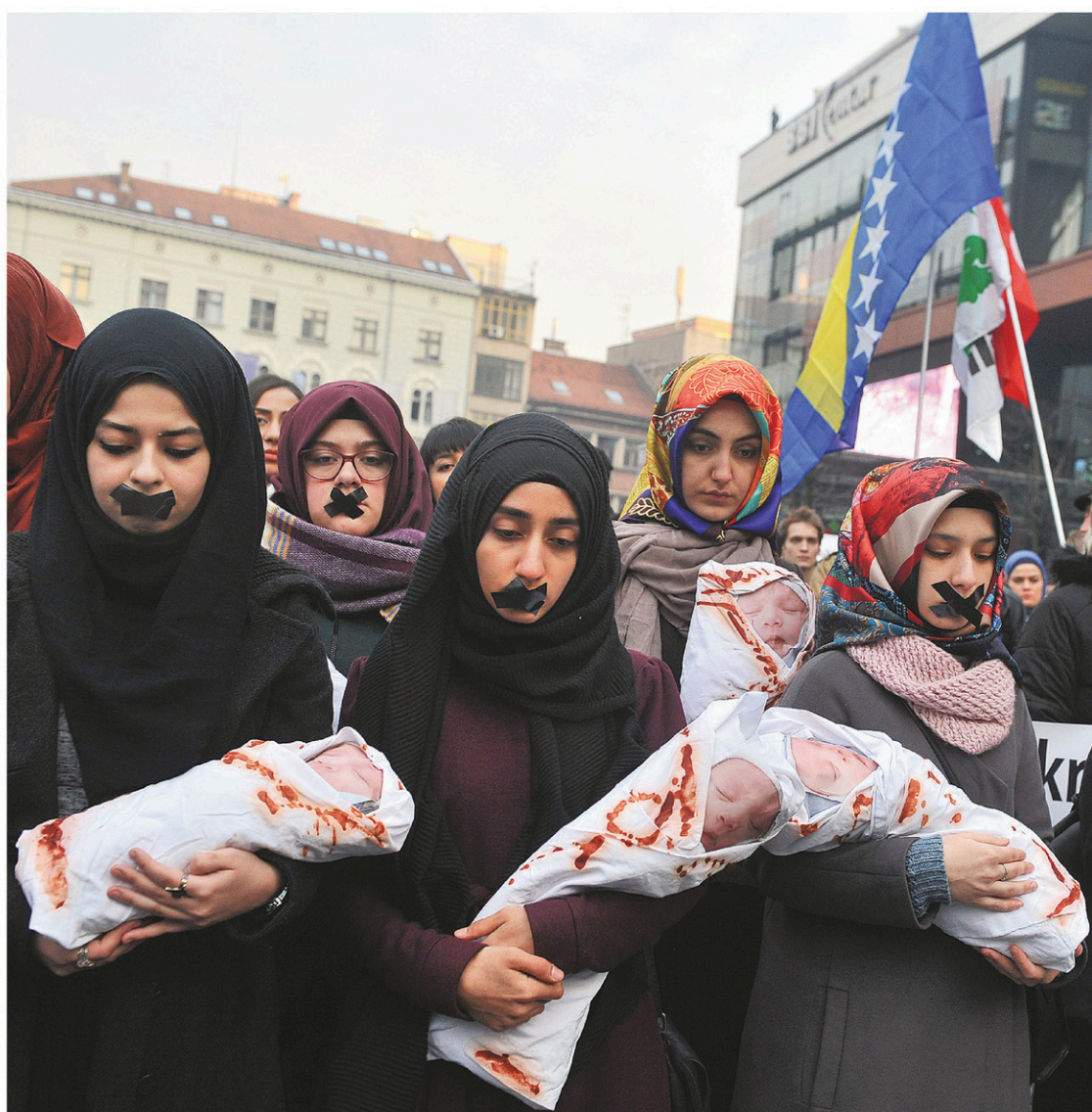
Des jeunes femmes bosniaques ont dénoncé mardi le sort des victimes dans le siège d'Alep.

Mais ces informations sur un nouvel accord ont été démenties par une source