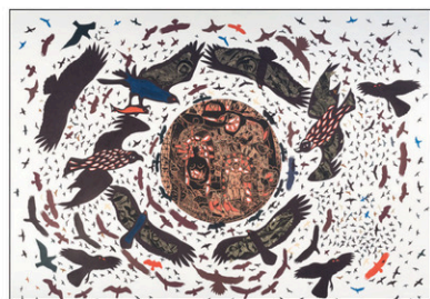
RAPACES C 2 2015 Papier collé et linogravure 108x153 cm

EXPOSITION RAPACES Jusqu'au 17 décembre René Derouin