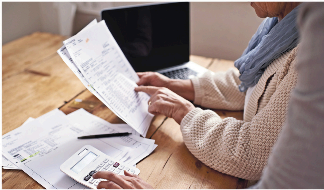
La dette des ménages totalisait 2004 milliards à la fin du troisième trimestre.

La dette totale des ménages totalisait 2004 milliards à la fin