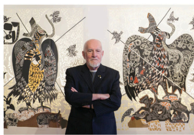
La constellation de l'aigle, Collection de Hélène et Marc Lusier

Il ne reste que 3 JOURS pour voir RAPACES