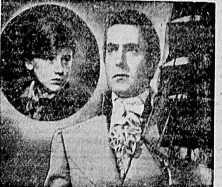
Tyrone Power et Roddy McDowall dans une scène du film français "Le Cavalier de la Vengeance", que l'on verra au cinéma Orpheum.