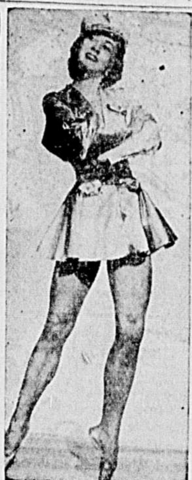
Tous les amateurs de ballet seront sans doute ravis d'apprendre que la belle ballerine Irina Baronova sera aux côtés de Léonide Massine et des membres de son ensemble lors de la soirée de ballet en plein air qui sera présentée mardi le 3 juillet au stade Molson.

Le second film à l'affiche sera "Le Porte-Veine" mettant en vedette l'amusant comique Lucien Baroux et une troupe d'acteurs de premier plan.