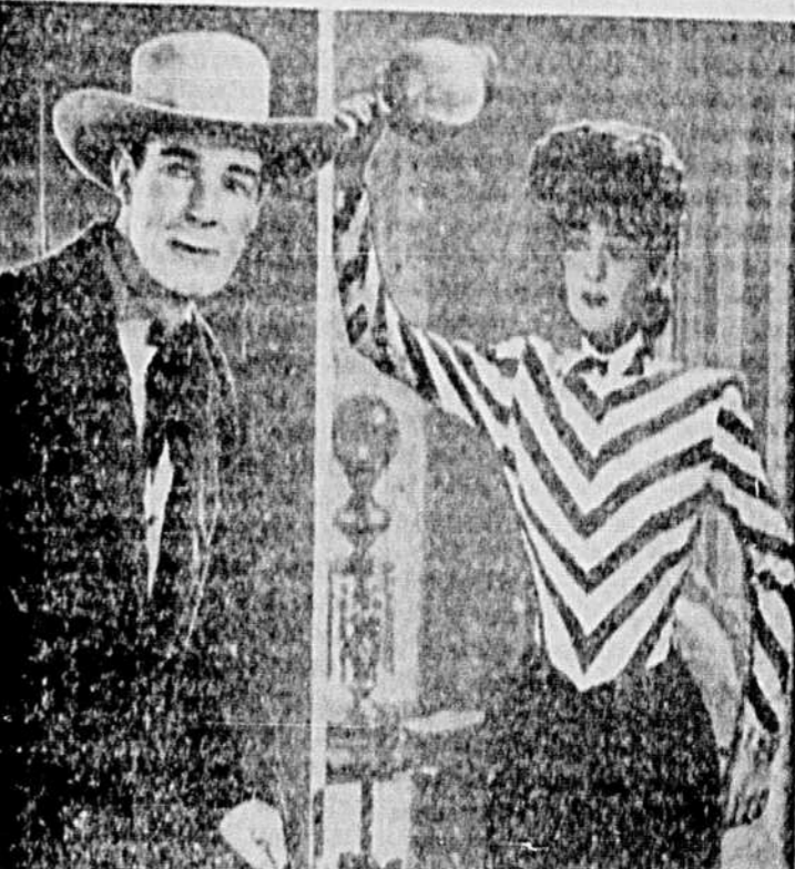
Randolph Scott et Gipsy Rose Lee dans "Belle of the Yukon", qui prend l'affiche au Capitol.