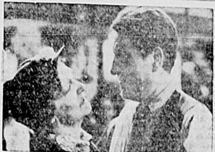
Marcelle Géniat et Jean Gabin dans une scène du film "La Belle Equipe" des samedi à l'affiche du SAINT-DENIS.