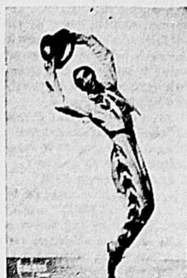
Léonide Massine, une des plus célèbres figures du monde de la danse, qui sera à la tête de son propre ensemble de Ballet Russe, mardi, le 3 juillet, au stade Molson, lors de la première fois à Montréal on aura l'occasion d'assister à une soirée de ballet en plein air dans un décor enchanteur.

Les forces armées ont utilisé 1,179,000 verges de flanellette en 194.