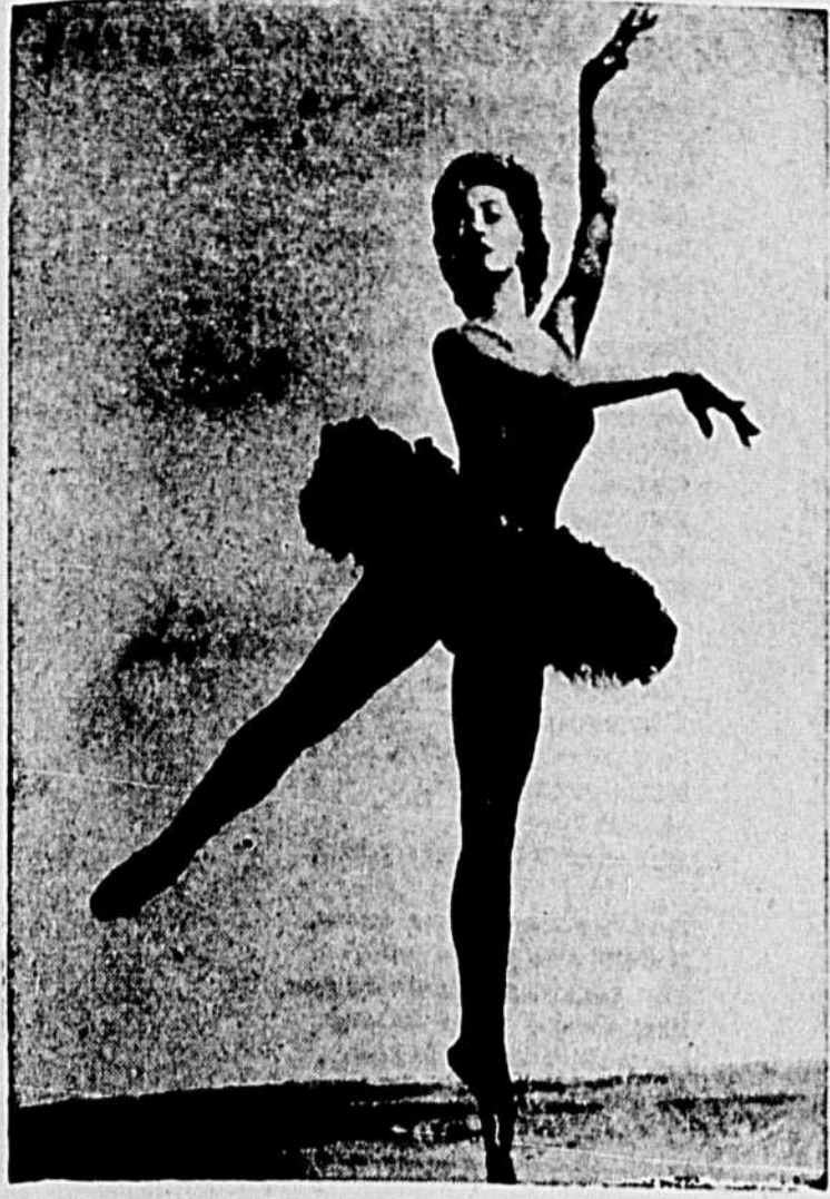
Irina Baronova, une des plus grandes gloires du ballet que l'on aura le plaisir de voir évoluer avec Léonide Massine et son ensemble lors d'une soirée de ballet en plein air qui sera présentée mardi le 3 juillet au stade Molson, l'amphithéâtre de l'avenue des Pins.