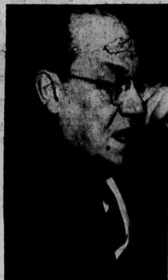
Photographie de Son Honneur Camille Houde, maire de Montréal, prise au moment où il inaugurait le service téléphonique direct Montréal-Val d'Or.