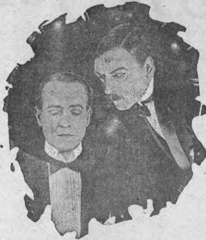
Il lui suggéra de tuer Kirke