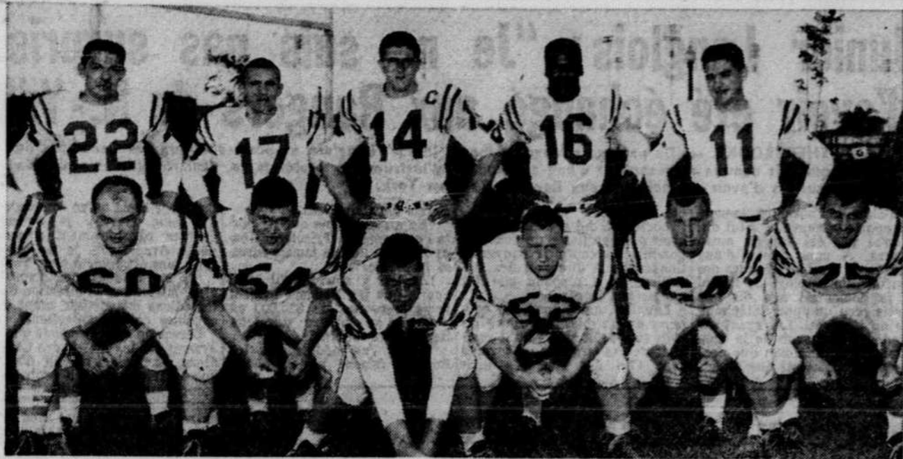
L'équipe des Blancs qui se mesurera aux Rouges cet après-midi, au parc Jarry, dans une joute de football inter-équipes, est formée notamment des futures étoiles sur la photo ci-dessus. Ces jeunes font tous partie du camp d'entraînement des Alouettes et selon l'instructeur Perry Moss, plusieurs d'entre eux ont l'étoffe du Big Four. La partie débutera à trois heures.