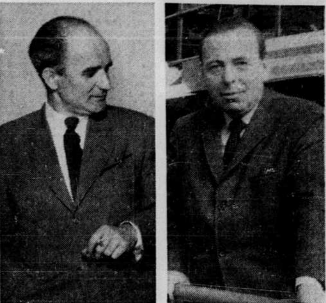
Pelletier: une institution établie à maintenir. Gagnon: des millions pour un nouveau journal.

Le comptable de l'hôpital, M. Georges-Marie Larose, a déclaré hier qu'il ne pouvait pas retrouver les chèques faits à l'ordre de M. Courtemanche à même le fonds de construction de l'hôpital ou tirés sur le fonds de frais chirurgicaux. On a retracé les sommes versées au sénateur en scrutant les talons des chèques. Actuellement, le sénateur réside sur la rue Grande-Allee, dans une maison dont il se peut-être question un peu plus tard dans l'enquête.