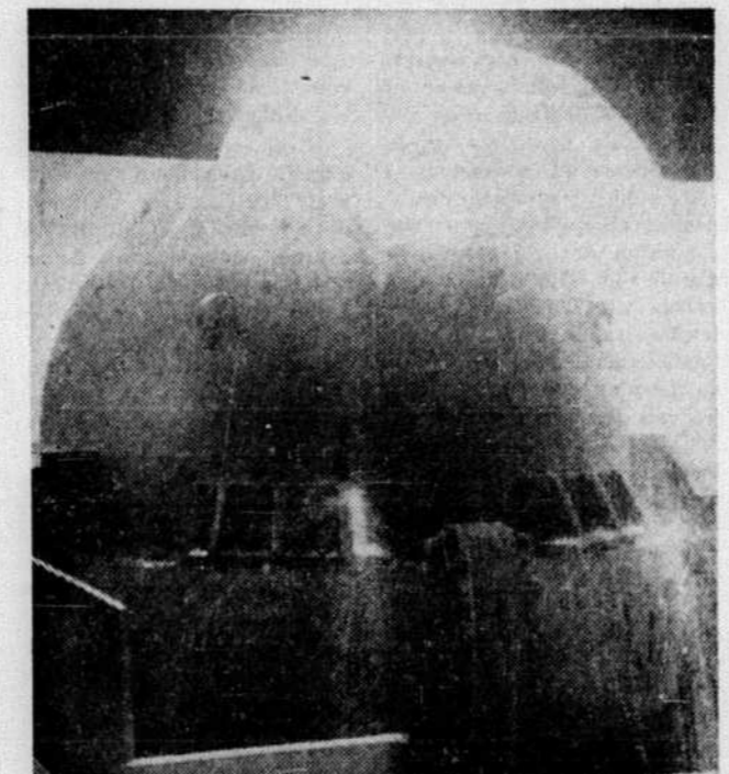
Le four à oxygène d'Algoma Steel

Tout est spectaculaire et à l'échelle de Titans à l'aciérie d'Algoma, que le public peut visiter en été. L'impressionnante visite a débuté au four à oxygène où le fer en gueuse réduit à l'état liquide, mélangé à la ferraille, est déposé par une large benne dans le four à revêtement intérieur de briques réfractaires. Ce procédé sert surtout, à la fabrication de l'acier G40.8. Les deux fours ont été installés en 1958; on y produit 70 tonnes d'acier à la fois par le procédé "L-D Oxygen" de l'entreprise Linde. Une usine produit sur place l'oxygène. La briques est changée dans ces fours tous les douze jours.