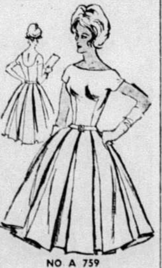
NO A 759