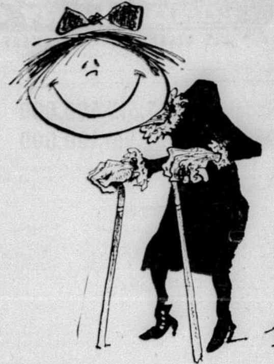
La tête fait assez enfantin, c'est le corps qui est trop vieux