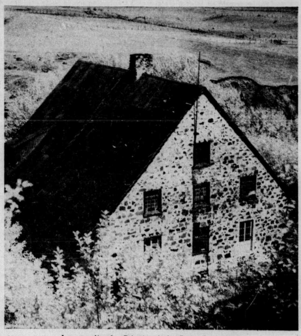
Le moulin la Rémie, à la Baie Saint-Paul