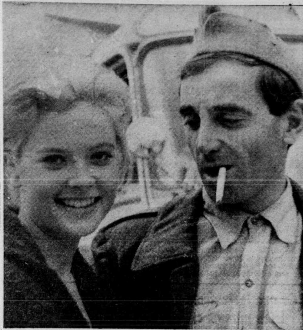
Charles Aznavour et Cordula Trantow, dans une scène de "Passage du Rhin", actuellement à l'affiche de la Comédie canadienne.