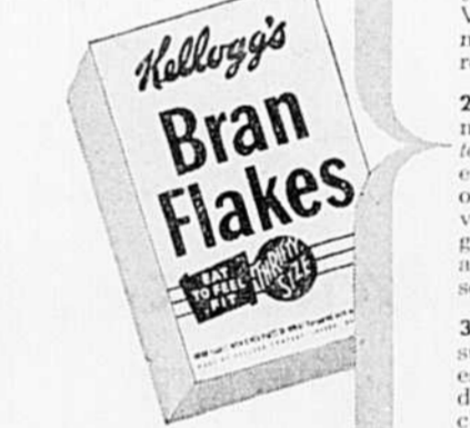
Les Kellogg's Bran Flakes sont délicieux. D'après une récente enquête, 3 ménagères canadiennes sur 4 préfèrent les Kellogg's à toute autre marque.

Les Bran Flakes, Pop, Corn Flakes, All-Bran, Rice Krispies, Krumbles et All-Wheat sont tous faits par Kellogg's, la meilleure marque en fait de céréales.