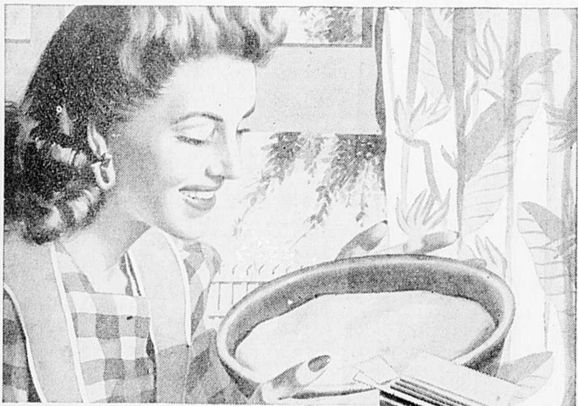
Mettez la nouvelle Leveur Royal dans l'eau; elle commence à agir en 10 minutes.