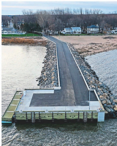
La cession du quai du Port Saint-François est encore reportée.