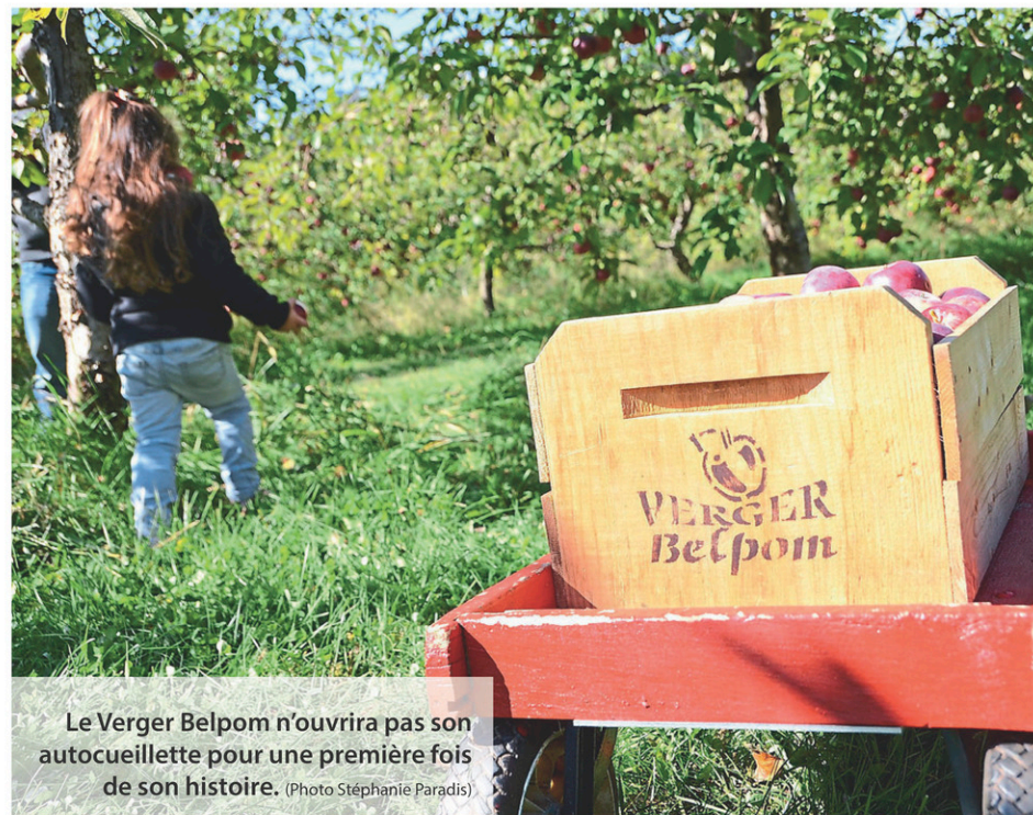
Le Verger Belpom n'ouvrira pas son autocueillette pour une première fois de son histoire.

En ce qui concerne les travaux de décontamination du terrain de l'école, ils sont maintenant terminés. Ces travaux, réalisés par l'entreprise Équipements Martel, visaient à retirer certains éléments de l'école incendiée encore présents dans le sol et de rendre conforme le terrain sur lequel sera construite la nouvelle école. Rappelons que celle-ci comptera cinq classes et un gymnase. (M.E.V.)