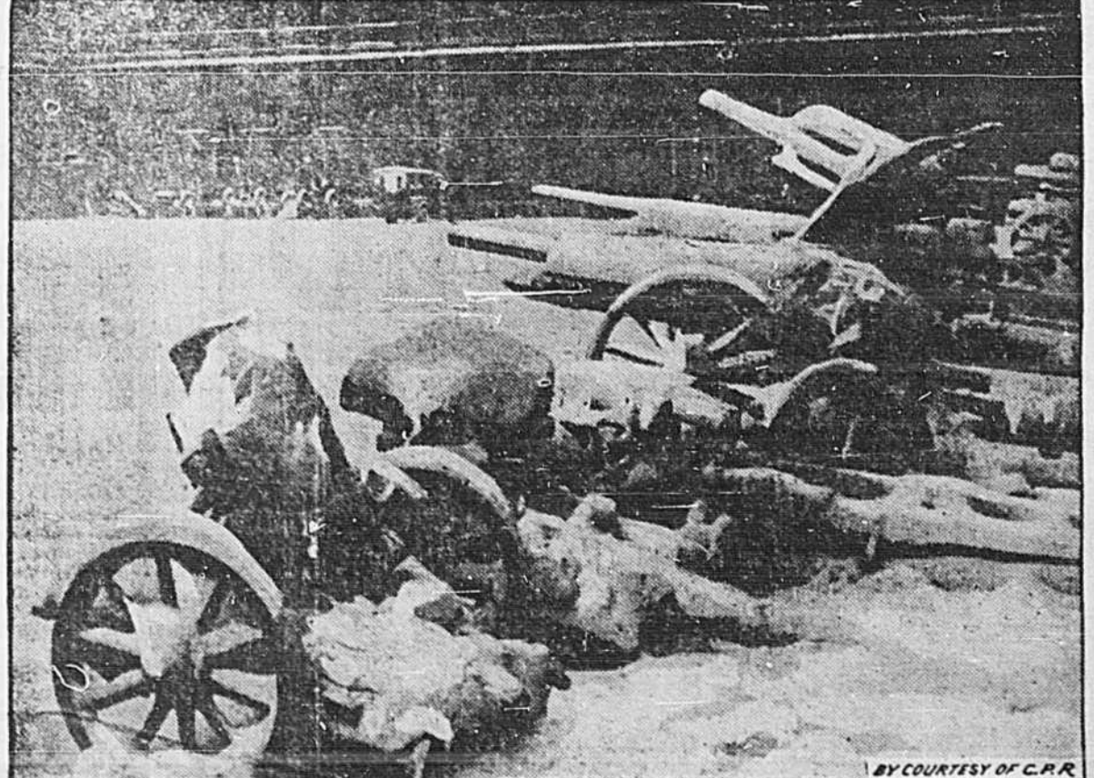
Le Canada n'a pas le monopole des épaisses bordées de neige. Ces canons allemands signés dans la cour des Invalides à Paris, rappellent sous leur toilette hivernale, la fameuse armée qui désastreuse retraite de Russie, au cours de laquelle fut perdu dans les steppes immenses de l'empire des tsars, tout le matériel d'une armée qui devait achever la conquête de l'Europe.