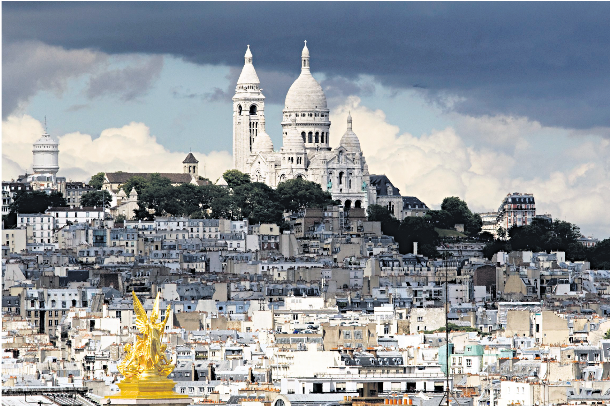
La cathédrale du Sacré-Cœur trône orgueilleusement sur le sommet de la butte Montmartre, comme un joyau sur un quartier qui a accueilli les plus grands peintres.

risotto de légumes, une pintade fermière à l'embeurrée de chou ou un agneau de lait de l'Aveyron, tout cela présenté en portions qui contenteront les plus solides appétits.