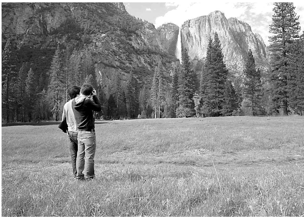
Sur cette photo de la chute Yosemite, dans le parc national du même nom situé en Californie, on remarque que le couple et la chute sont placés sur des points forts aux tiers de l'image.

Avez-vous besoin d'un zoom de 5X seulement pour bien cadrer? De 10X pour des portraits? De 30X pour les oiseaux? Pour les autres critères, pensons entre