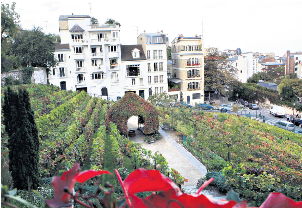
En se promenant sur la butte, on aura peut-être le bonheur d'admirer les vignobles bien cachés qui poussent sur les pentes du quartier. Un véritable trésor en pleine ville de Paris.

Même credo à cinq minutes de là, au Grand 8 (8, rue Lamarck), où on apporte un soin particulier aux vins, tous en biodynamie, ce qui promet des réveils plus aisés même si on en abuse un peu, trop tentés par tous ces élixirs qui accompagneront si bien une cassolette de saucisse fumée, des coquilles Saint-Jacques au