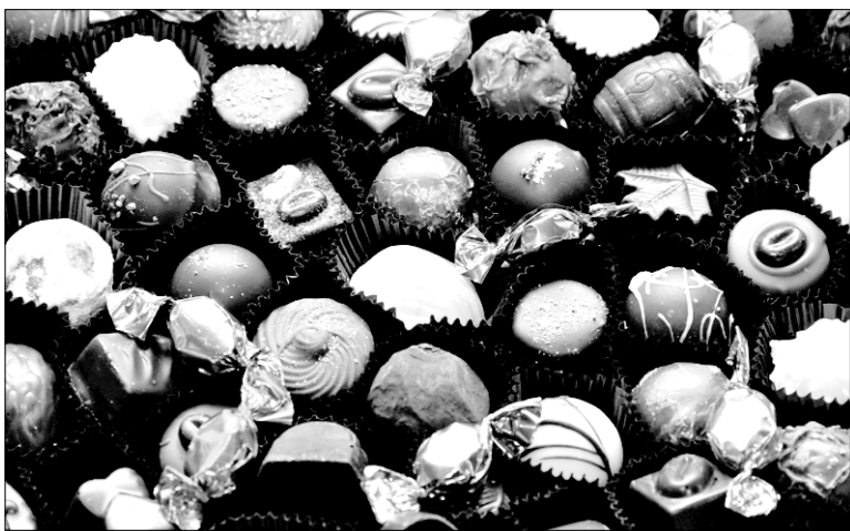
La 12 e Fête du chocolat de Bromont aura lieu les 19, 20, 21, 26 et 27 mai dans le quartier patrimonial de Bromont.