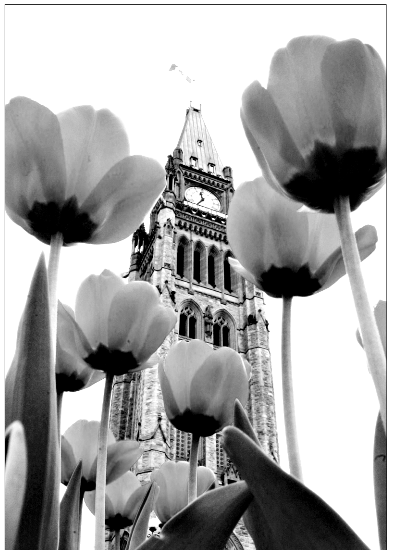
Le Festival canadien des tulipes, du 4 au 21 mai à Ottawa et Gatineau, permet de s'émerveiller devant plus de trois millions de tulipes fleurissantes.

→ Il s'agit du plus grand festival de tulipes au monde. La preuve? Plus de trois millions de tulipes fleurissent plus de 20 lieux de la capitale nationale, dont la colline parlementaire et le Casino du Lac-Leamy, à Gatineau. Le festival propose plusieurs activités pour la famille, telles que des concerts, des expositions et un défilé de bateaux décorés sur le canal Rideau. Du 4 au 21 mai à Ottawa et à Gatineau. 613 567-5757 www.festivaldestulipes.ca