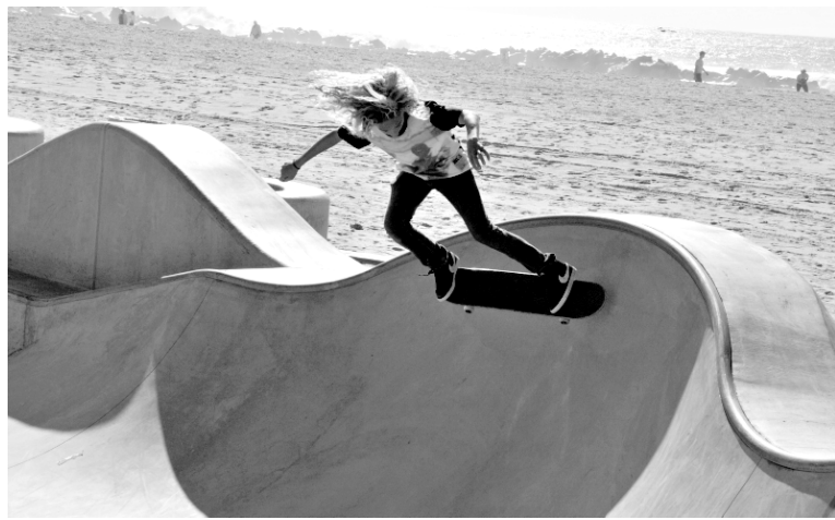
Jeune homme en planche à roulettes sur la plage de Venice.