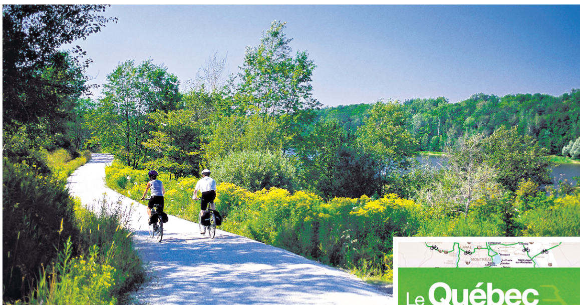
Parmi les guides pratiques destinés aux cyclistes, Le Québec cyclable répertorie les circuits accessibles dans les 17 régions du Québec, dont celui du parc national de la Yamaska.

Le Québec à vélo: 20 circuits découverte au Québec est une invitation à découvrir à vélo la beauté de notre territoire, entre les lacs et les rivières, entre la plaine agricole et la montagne ou au détour de villages pittoresques. Qu'il s'agisse du parcours des oies, d'une escapade au pays de la pomme, d'un circuit dans le parc de la Gatineau ou aux Îles-de-la-Madeleine, ces 20 circuits découverte d'un à trois jours sont abondamment détaillés: le nombre de kilomètres, le type de chaussée, le degré de difficulté, le point de départ et la façon de s'y rendre... Chaque itinéraire est accompagné d'une carte et détaillé kilomètre par kilomètre: il propose des attraits à visiter, des haltes