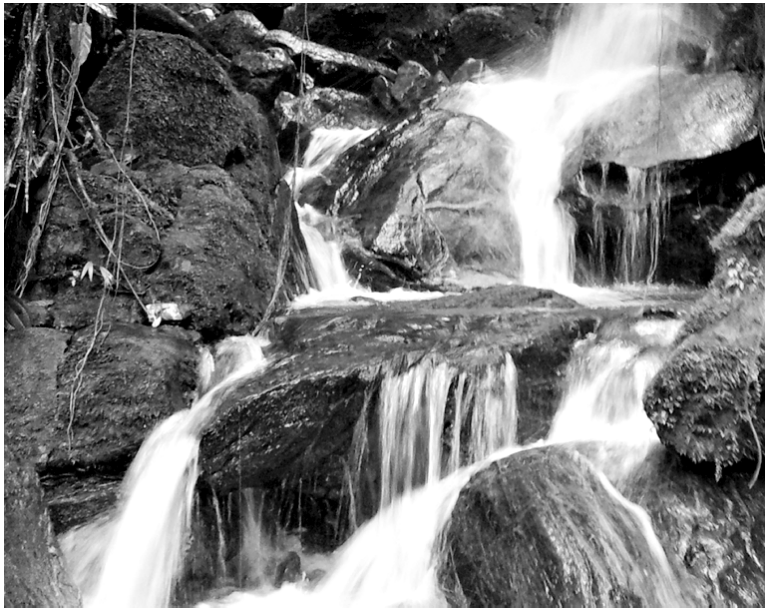
Une petite cascade d'eau qu'il fait bon rencontrer pour se rafraîchir après de longues heures de marche dans une forêt chaude et humide.

Les deuxième et troisième journées, beaucoup plus courtes