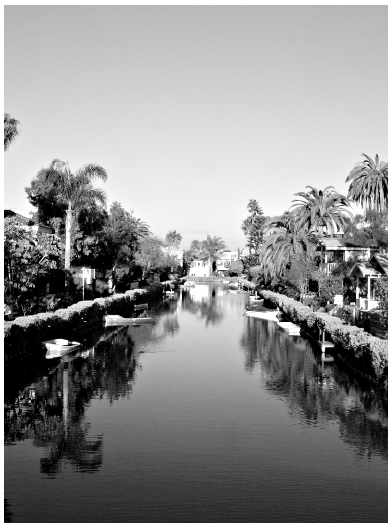
Les canaux de Venice, presque comme à Venice...

L'un des meilleurs endroits pour voir le coucher du soleil à Venice Beach est le bar situé sur le toit de l'hôtel Erwin. Les consommations ne sont pas données, mais on paye un peu aussi pour la vue de 180 degrés sur l'océan Pacifique. Ne soupez pas là, la nourriture y est très, très ordinaire. Rendez vous plutôt chez Piccolo, dans la minuscule rue piétonne Dudley, l'un des meilleurs restaurants italiens de Los Angeles, et sans aucun doute aussi l'un des plus romantiques. Erwin: 1697, Pacific Ave., jdvhotels.com/hotels/losangeles/erwin ; Piccolo: 5, Dudley Ave., piccolovenice.com