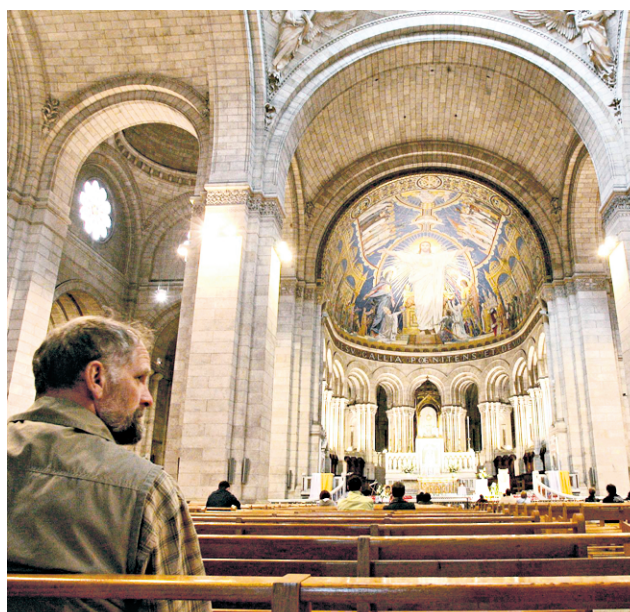
Un homme est assis dans la magnifique cathédrale du Sacré-Cœur qui domine la butte Montmartre à Paris.