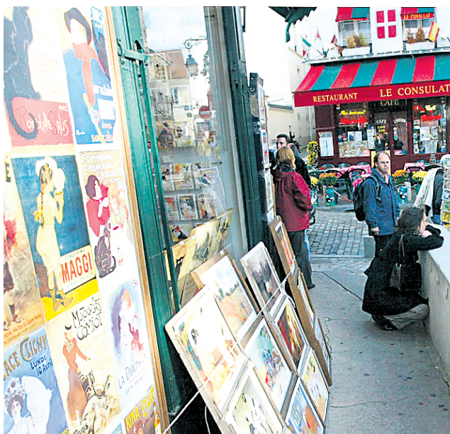
Les artistes sont toujours présents dans le quartier Montmartre, notamment à la place du Tertre.