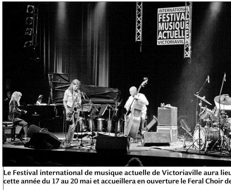
Le Festival international de musique actuelle de Victoriaville aura lieu cette année du 17 au 20 mai et accueillera en ouverture le Feral Choir de

→ Le printemps est sucré à Bromont. Chaque année, confiseurs, artisans-chocolatiers et grand public s'y donnent rendez-vous pour célébrer le chocolat. La 12 e Fête