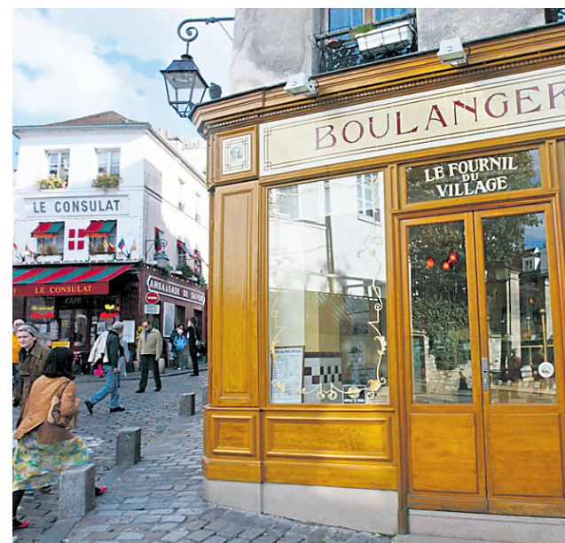
Une boulangerie du quartier, le Fournil du Village, montre bien que la butte est habitée.