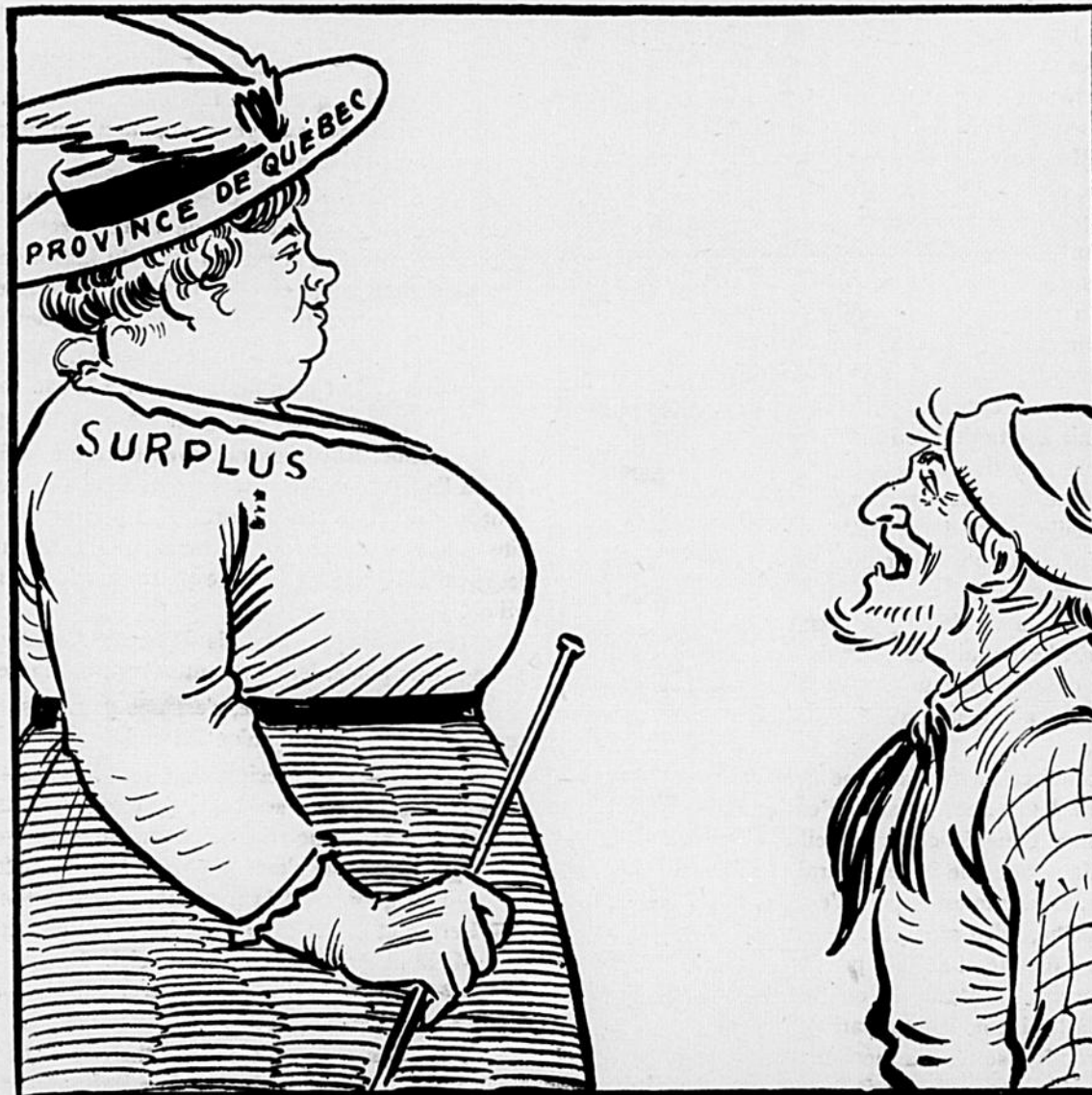
LADEBAUCHE.—Ma foi du bon Dieu... elle prend trop de pilules rouges.

La Province de Québec est en bonne santé