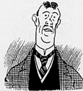
Le propriétaire de l'hôtel.

—Pas de train dans ma maison, dit le propriétaire de l'hôtel en empoignant Bouctouche d'une main solide et en l'envoyant rouler sur le plancher de la barre.