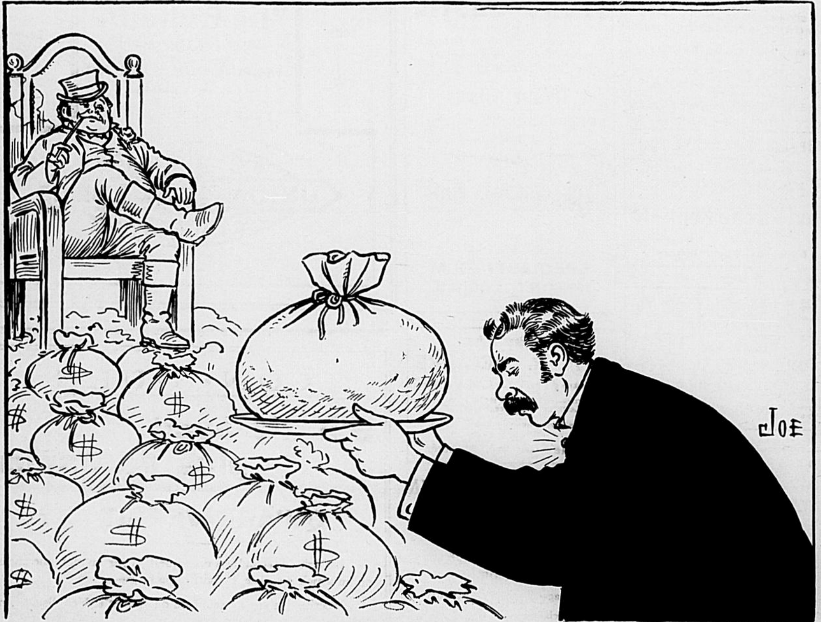
BORDEN. —Voici encore de l'argent que le Canada t'offre en plus des hommes qu'il envoie au front.