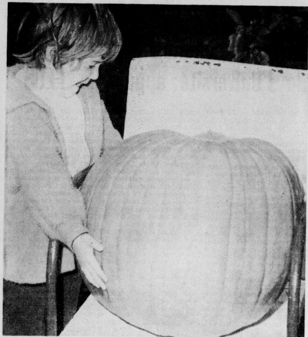
Une fillette tente de soulever cette citrouille "record" de 66 livres et mesurant 61 pouces de circonférence. Ses efforts se sont avérés vains mais elle soit fort bien que la fête des jeunes approche et que l'Hallowe'en est symbolisée par la citrouille.

Votre Jour CHANCEUX... pourquoi pas aujourd'hui? Vous pouvez être gagnant en consultant nos pages D'ANNONCES CLASSÉES