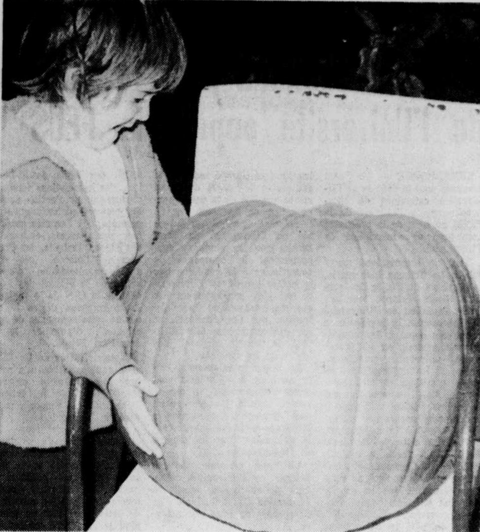
Une fillette tente de soulever cette citrouille "record" de 66 livres et mesurant 61 pouces de circonférence. Ses efforts se sont avérés vains mais elle sait fort bien que la fête des jeunes approche et que l'Halloween est symbolisée par la citrouille.