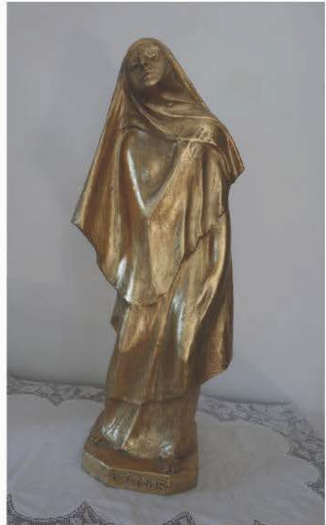
« L'âme » d'Alfred Laliberté