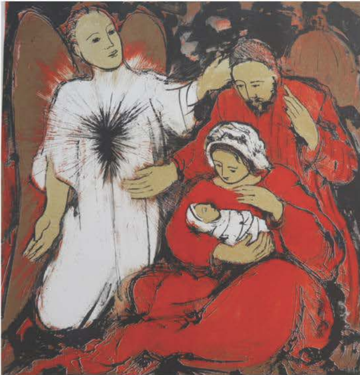
« La Nativité » d'André Bergeron

Cette année encore, le musée a acquis quelques pièces d'importance venant enrichir sa collection. Les acquisitions les plus notables de cette dernière année sont un plâtre original d'Alfred Laliberté, « L'Âme » ainsi qu'un coffret de 9 estampes, « La Nativité » de l'artiste André Bergeron. À cela, on peut aussi souligner l'acquisition d'une porte du couvent des Sœurs du Précieux-Sang qui sera mise à contribution dans l'exposition sur le 350e de Nicolet.