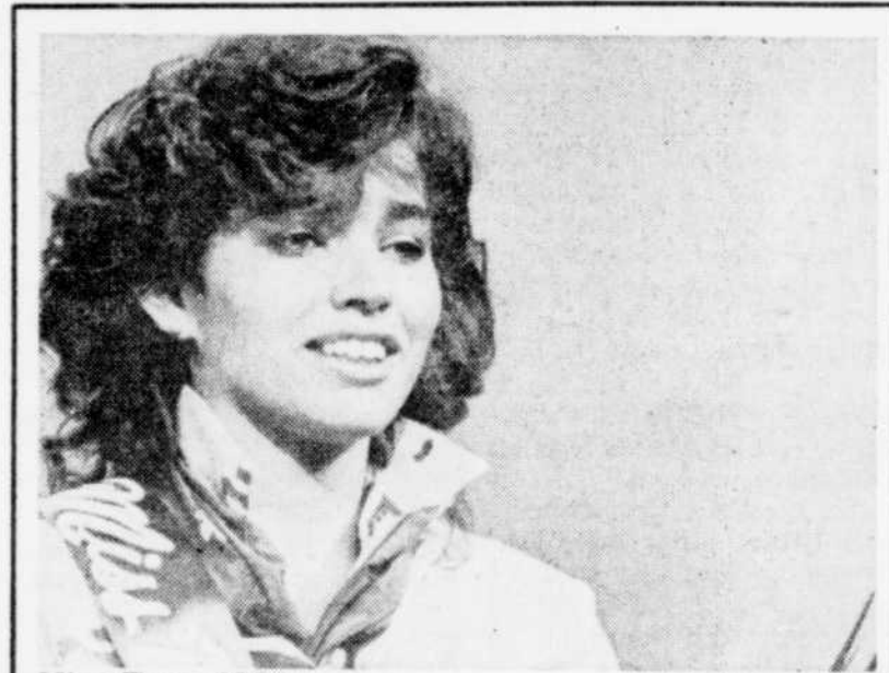
Miss Teen 1984

Etiez-vous nerveux le jour de vos nocces? "Les nerfs, moi je ne connais pas ça", rétorque-t-il.