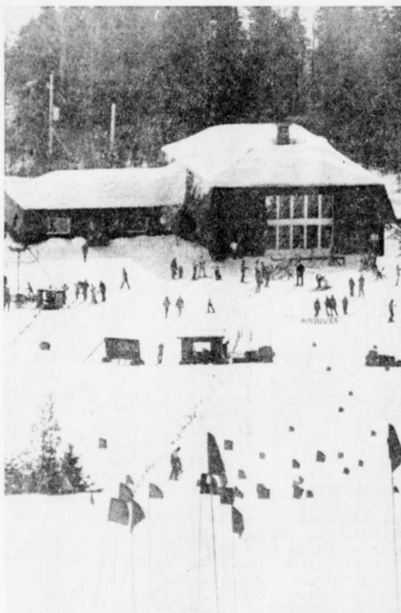
Le chalet du centre de ski au mont Orignal avec son épais manteau de neige.

Et à long terme, l'agrandissement du chalet d'accueil et la construction d'hé-