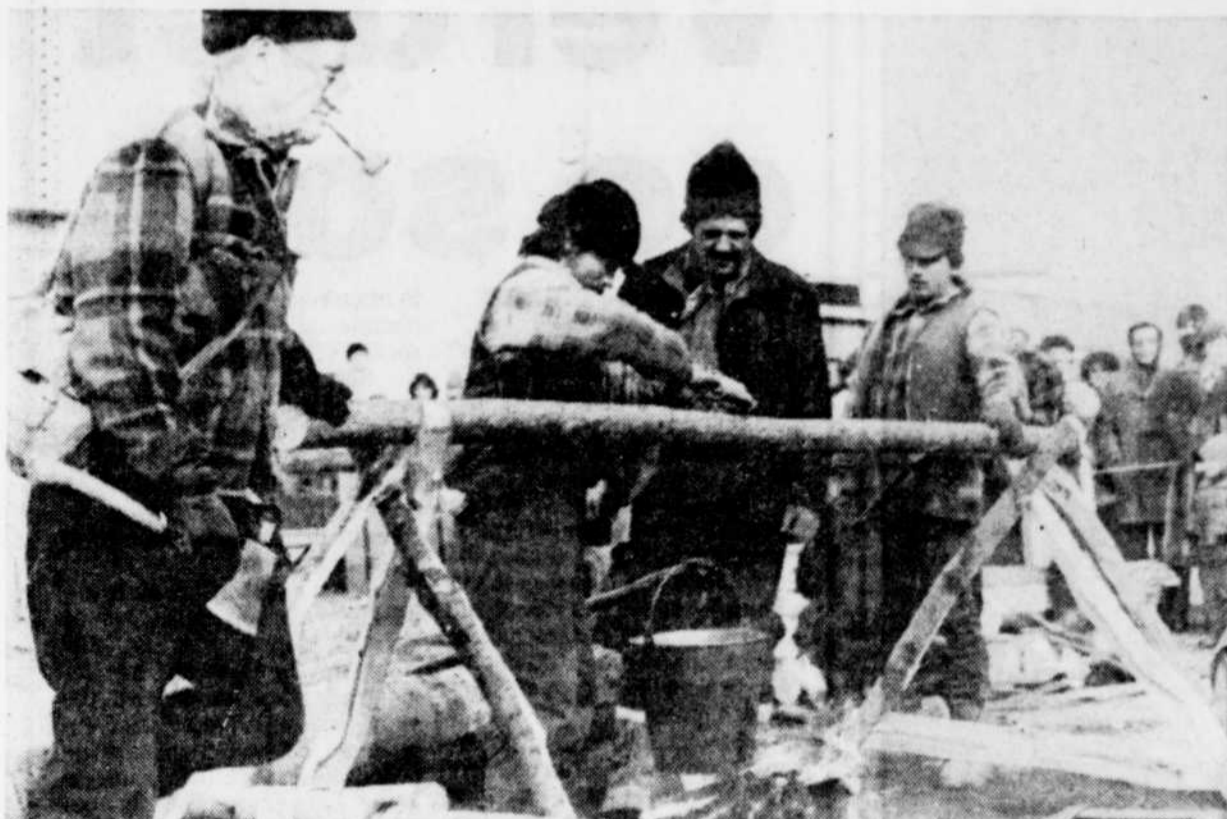
Au marché public, les bûcheux montent le camp pour l'hiver.