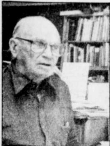
Le Soleil, Yvon Mongrain