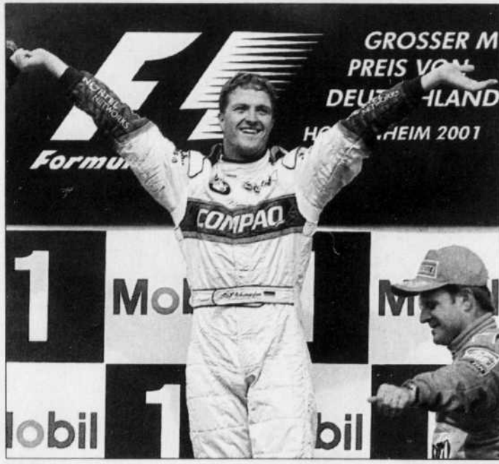
«Moteur allemand, pilote allemand, course allemande: le parfait scénario», selon Ralf Schumacher.

«J'ai souvent manqué de chance sur ce circuit et je n'ai pas toujours fini bien placé. Alors ça fait du bien de gagner ici», a déclaré Ralf Schumacher, qui a signé son troisième suc-