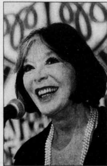
Juliette Gréco a paru en grande forme, à 74 ans, aux FrancoFolies de Montréal.

Épiloguer sur la voix qui n'a plus les textures d'antan ou sur le souffle plus court qui, forcément, fait débouler les mots, supposerait que le journal que vous tenez entre vos mains ne jaunira jamais. Or, tout au long de ce récital — où Gréco, fidèle à son habitude, suspendit le temps — tous les sentiments étaient là, et l'interprète, en grande forme à 74 ans, les vivait comme si c'était la première fois: les cadeaux de Gainsbourg ( Accordéon, La Javanaise ), les offrandes de Ferré ( Jolie môme, Paris canaille ), le clin d'œil de Trenet ( Coin de rue ), sans oublier l'incontournable héritage de Brel, que la dame a généreusement partagé en cinq titres (dont