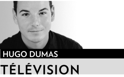
HUGO DUMAS TÉLÉVISION

Avec 15 nominations chacune — une de plus que Bunker l'an dernier —, les séries Fortier et Grande Ourse mènent le bal dans l'attribution des prix Gémeaux, qui se déroulera le week-end des 27 et 28 novembre sur les ondes de Radio-Canada.