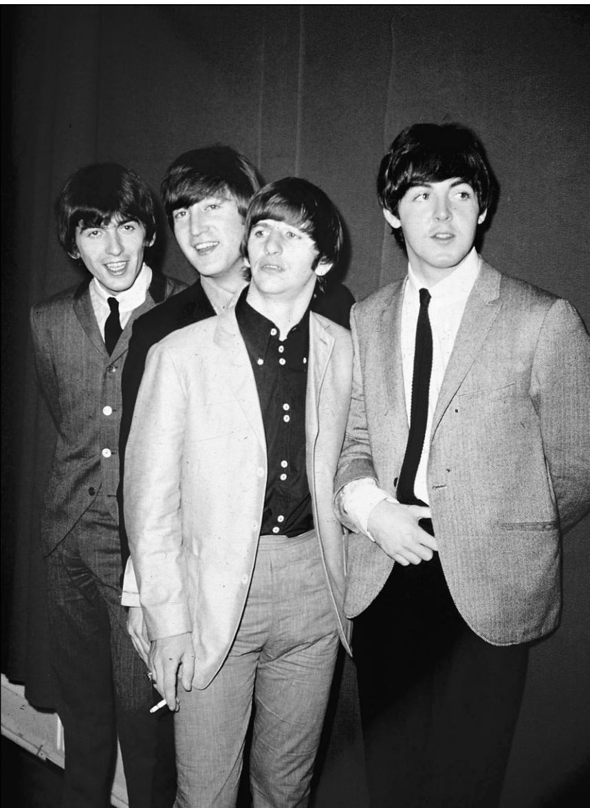
C'était en janvier 1964. Les Beatles étaient au sommet. Dans l'ordre habituel, George Harrison, John Lennon, Ringo Starr et Paul McCartney.