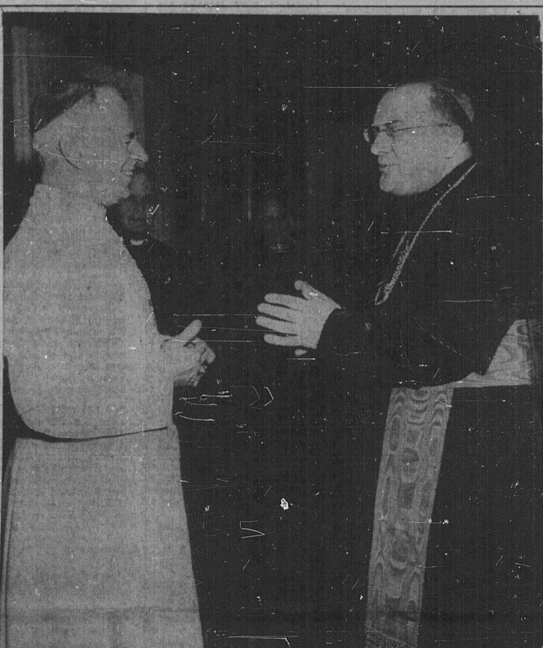
A North Bay

GANGTOK, Sikkim (Reuters) — Des informateurs dignes de foi affirment que des troupes soviétiques sont arrivées au Tibet, où elles sont entrées en action contre les rebelles. Ces mêmes sources précisent que les troupes soviétiques sont massées entre Gyantse, dans le centre du Tibet, où les communistes chinois avaient récemment accueilli de 100 à 200 militaires soviétiques, et la frontière ouest du Tibet. Les effectifs militaires sont arrivés au Tibet en provenance de la province chinoise de Sinkiang. Au même moment, les Chinois dirigeaient des vétérans de la guerre de Corée sur la scène des hostilités et s'emparaient de points stratégiques grâce au feu de leur artillerie auquel les rebelles de la tribu de Khamba n'étaient pas en mesure de riposter. Des 25.000 que seraient au total les rebelles de la tribu de Khamba, 5.000 ont cherché refuge en Inde. Plus de 10.000 Tibétains ont perdu la vie au cours de combats engagés à Lhasa à la mi-mars et un nombre identique a été déporté. L'exemple vient de haut. Entre-temps, le troisième personnage en importance du Tibet, Tseche Rimpoche, âgé de 15 ans et retrouvé dans une pauvre pension au loyer mensuel de 42 cents après s'être enfui du Tibet, a déclaré aux journalistes: "Nous avons quitté le Tibet parce que le dalaï-lama l'avait fui et nous n'y retournerons que le jour où il décidera de le faire."